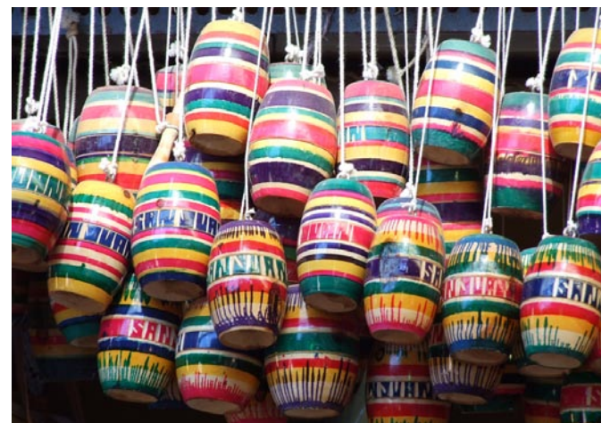
Color y artesanía presente.