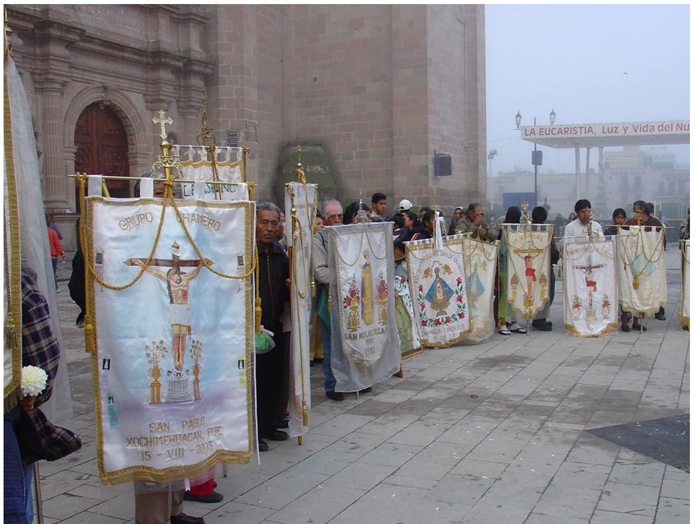
Tierra de tradiciones y cultura religiosa.

Imagen de la Virgen María en su advocación de la Inmaculada Concepción, considerada milagrosa y venerada en la ciudad de San Juan de los Lagos, en nuestro Estado.