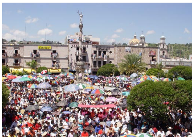
Fiesta anual al fervor de la Virgen de Lagos.