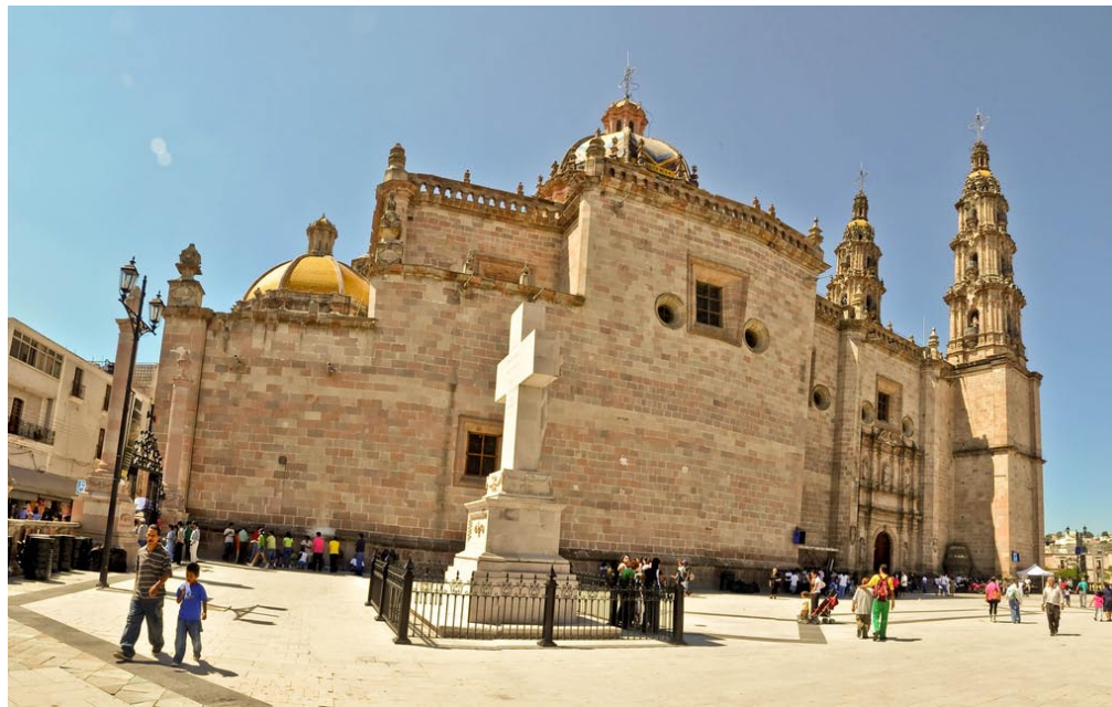
Parroquia de San Juan Bautista.

Monumento a la Independencia, erigido en 1872; ubicado en la Plaza Cívica Rita Pérez de Moreno, frente a la Basílica y consta de una esbelta columna con fuste decorado de guirnaldas y capitel compuesto, apoyada en base con cuatro figuras de dragón; sobre la columna se levanta una escultura en mármol de forma femenina, sosteniendo una corona de laurel.