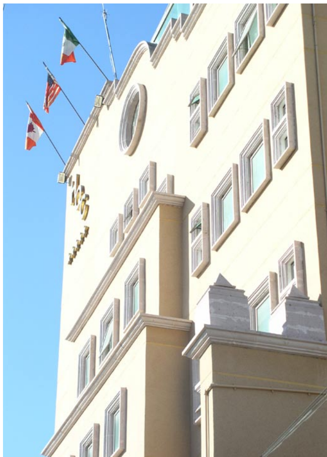
Hotel La Quinta Cesar

En el Hotel Real Santa Fe le ofrecerán la más cordial bienvenida a esta su casa en San Juan de los Lagos, Jalisco, su compromiso con usted es ofrecerle la mejor atención, confort y calidez, para que se sienta como en su casa.