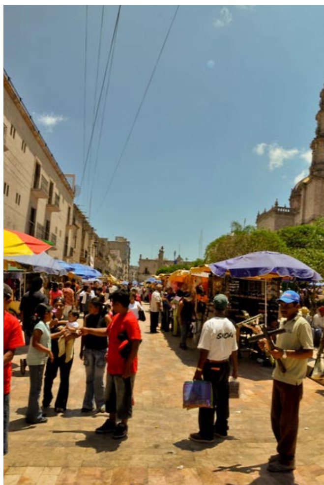
Otra vista del entorno urbano.

1542 Fundación del poblado de San Juan Bautista de Mezquititlán.