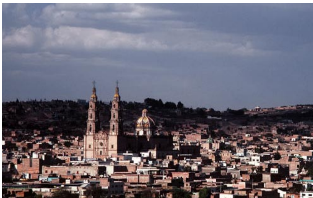
San Juan de los Lagos, Jalisco.

Es en ésta homogénea zona donde no tan sólo se define el perfil jalisciense, sino lo que es más importante, aquí están las bases de la esencia nacional.