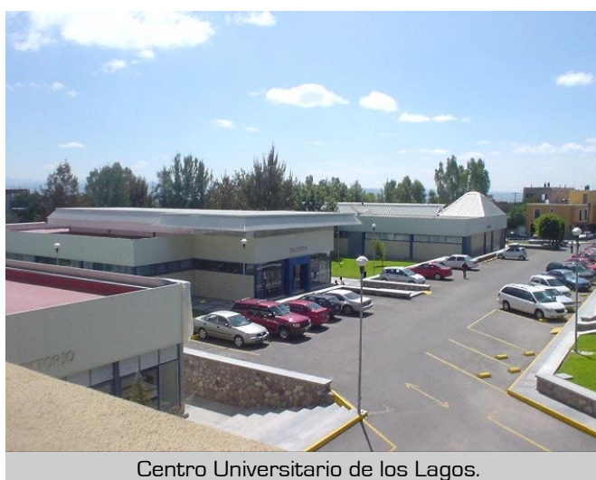
Centro Universitario de los Lagos.

Fundado el 17 de diciembre de 2004, el Centro Universitario de los Lagos con sede en Lagos de Moreno y San Juan de los Lagos, es una de las dependencias que componen la Red de la Universidad de Guadalajara.