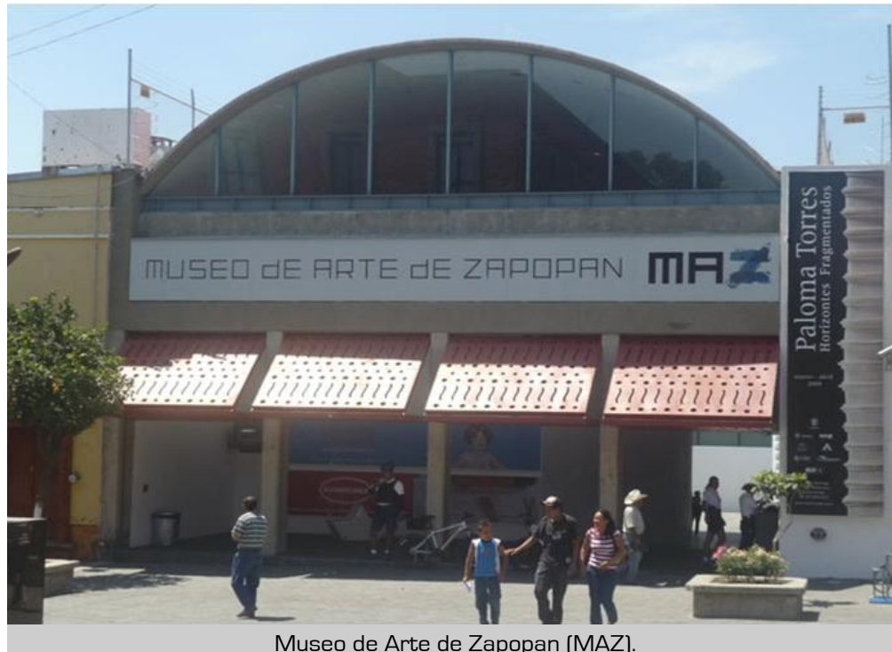
Museo de Arte de Zapopan (MAZ).

Asiste a los eventos que el Municipio organiza para ti, y conoce los sitios turísticos y culturales ubicados en Zapopan, los cuales amplían tus posibilidades de recreación, agregando una nota de cultura a tu vida.