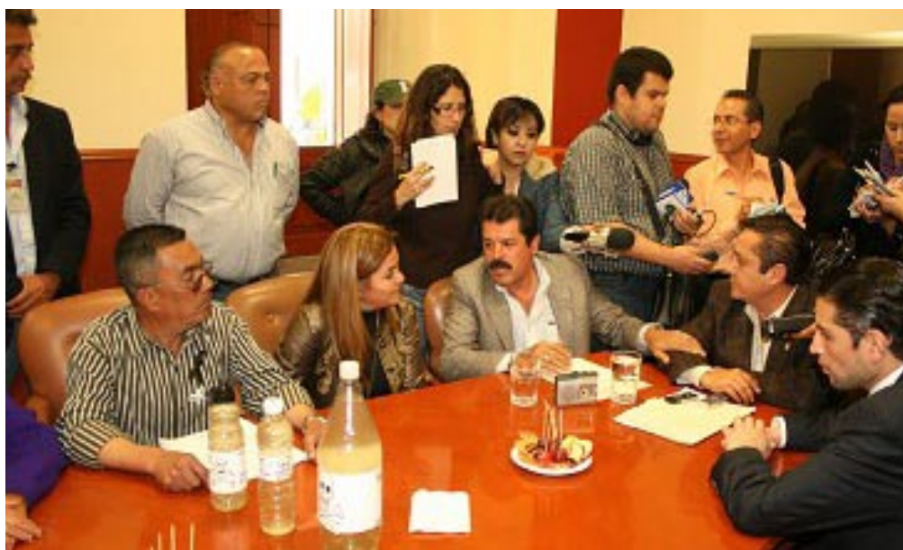
Comisión de Higiene y Salud.

La obesidad infantil es un problema de salud pública.