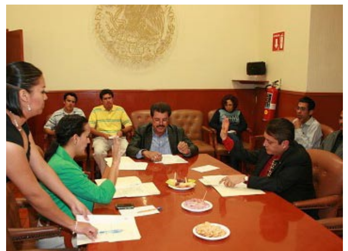
Trabajo de Comisiones.