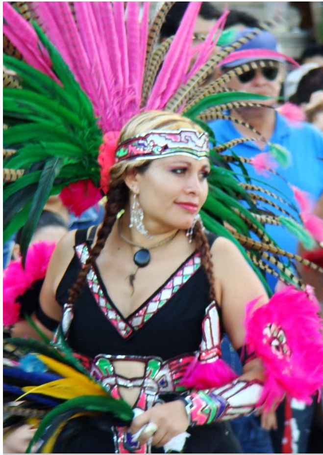
Celebración & Tradición.

Tradicionalmente se realiza del 25 al 27 de julio, pero en Santa Ana Tepetitlán la celebración ocurre del nueve al 12 de septiembre, y en Jocotán las celebraciones son del ocho al nueve del mismo mes.