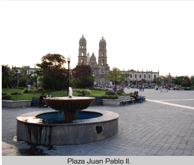
Plaza Juan Pablo II.

La Plaza Cívica, decorada con una escultura de bronce con la figura de un águila devorando una serpiente y una asta de bandera de siete metros de alto. El espacio sirve como marco para eventos cívicos del municipio y se encuentra frente al Palacio Municipal.