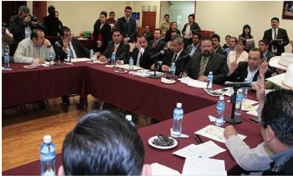
Comisión de Desarrollo Agrícola.

Con información en la mano, el Diputado enfatizó que es necesario ejercer los recursos, darle un apoyo total al campo para que México sea autosuficiente en alimentos, porque afirmó: “Si un país no es autosuficiente en alimentos, ese país está bien jodido”.