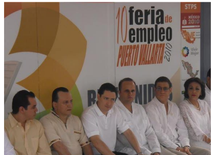
10ª Feria del Empleo.