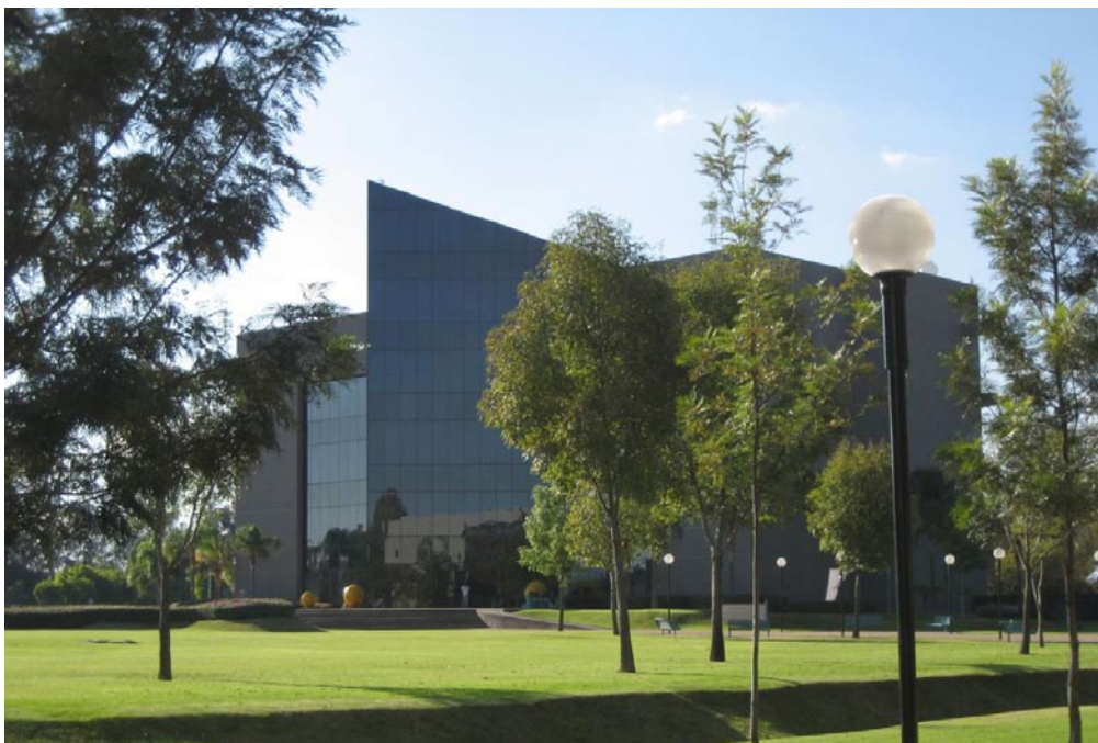
Tec. de Monterrey, Campus Guadalajara.

El municipio también alberga las estructuras centrales de la Universidad Autónoma de Guadalajara, la Universidad del Valle de Atemajac, de la Universidad de Guadalajara, así como del Tecnológico de Monterrey, de la Universidad Panamericana y la de Universidad del Valle de México.