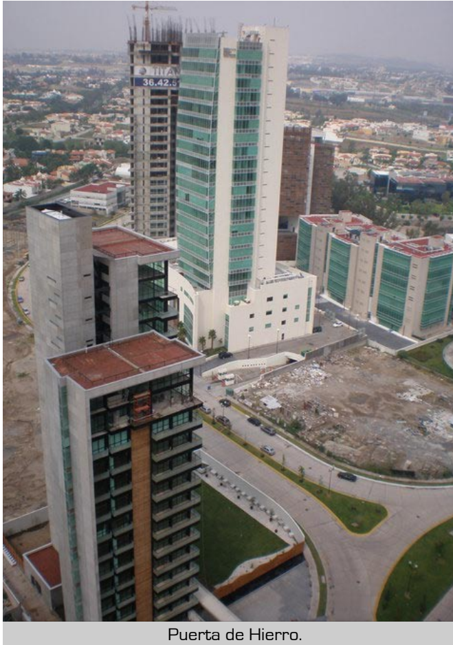
Puerta de Hierro.

El reflejo de los cristales sigue largas líneas, decenas de metros de altura y varios proyectos de edificación vertical dominan las tendencias del sector de la construcción en la ZMG, envuelta en un camino visible, donde las constante se define en trazos limpios y formas simples que colocan el segmento residencial, comercial y de oficinas como protagonistas principales de la transformación.