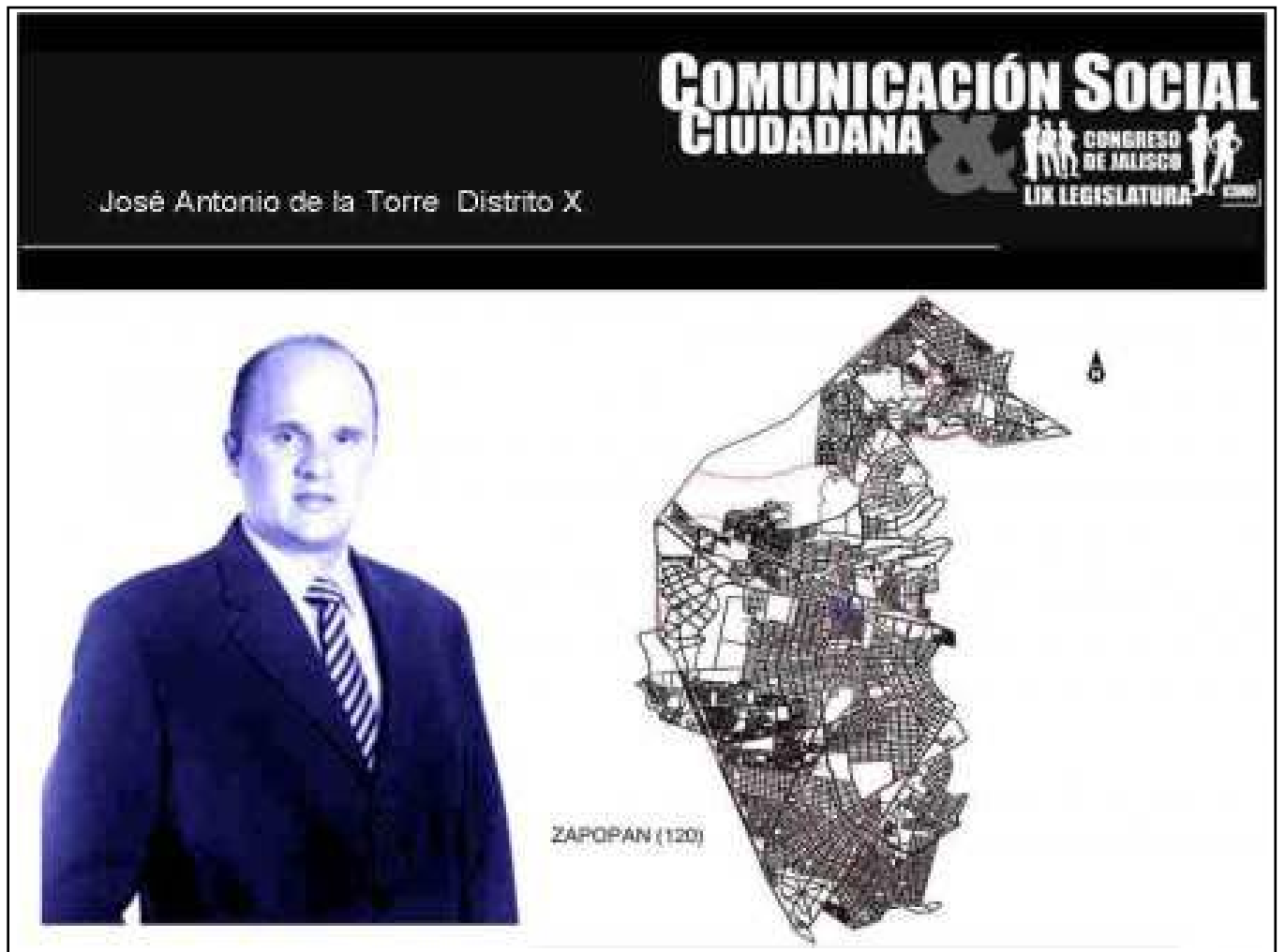
Distrito X, Bastión Panista de la ciudad de Guadalajara.

La fracción panista del Congreso del Estado de Jalisco se compromete con la creación de leyes que busquen solucionar problemas y enfrentar los retos y adversidades para el desarrollo de la ZMG.