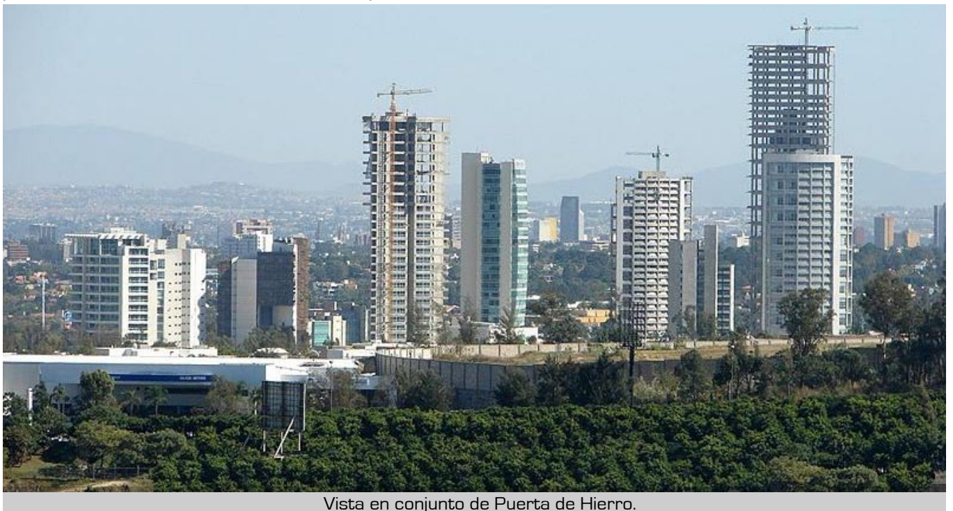
Vista en conjunto de Puerta de Hierro.

Ubicado en el municipio de Zapopan dentro de la Zona Metropolitana de Guadalajara, en Avenida Paseo Virreyes #250, Plaza Corporativa Zapopan, actualmente es el edificio más alto de la ciudad y el sexto más alto en México. La Torre Aura Altitude es de uso residencial y su altura es de 171 metros con 42 pisos, cada uno goza de una altura de cuatro metros.