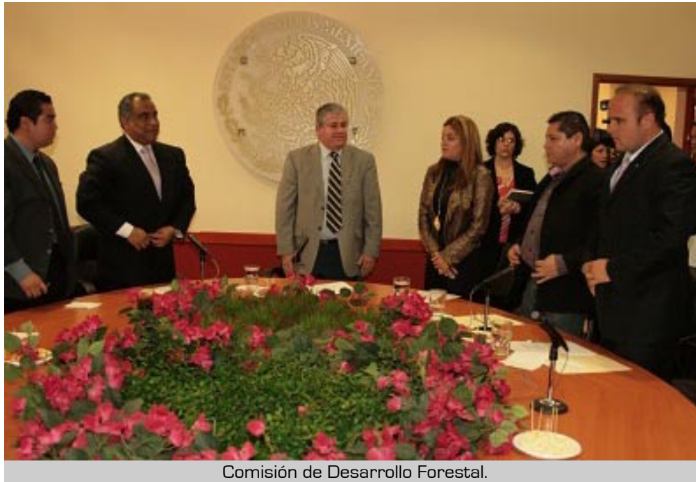
Comisión de Desarrollo Forestal.

Ante todo deberán estar dispuestos a que el trabajo sea con formalidad y con el respeto que merecen los jaliscienses.