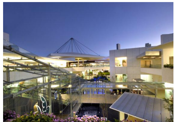
Otra perspectiva del Centro Comercial.