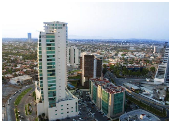
Hospital Puerta de Hierro.