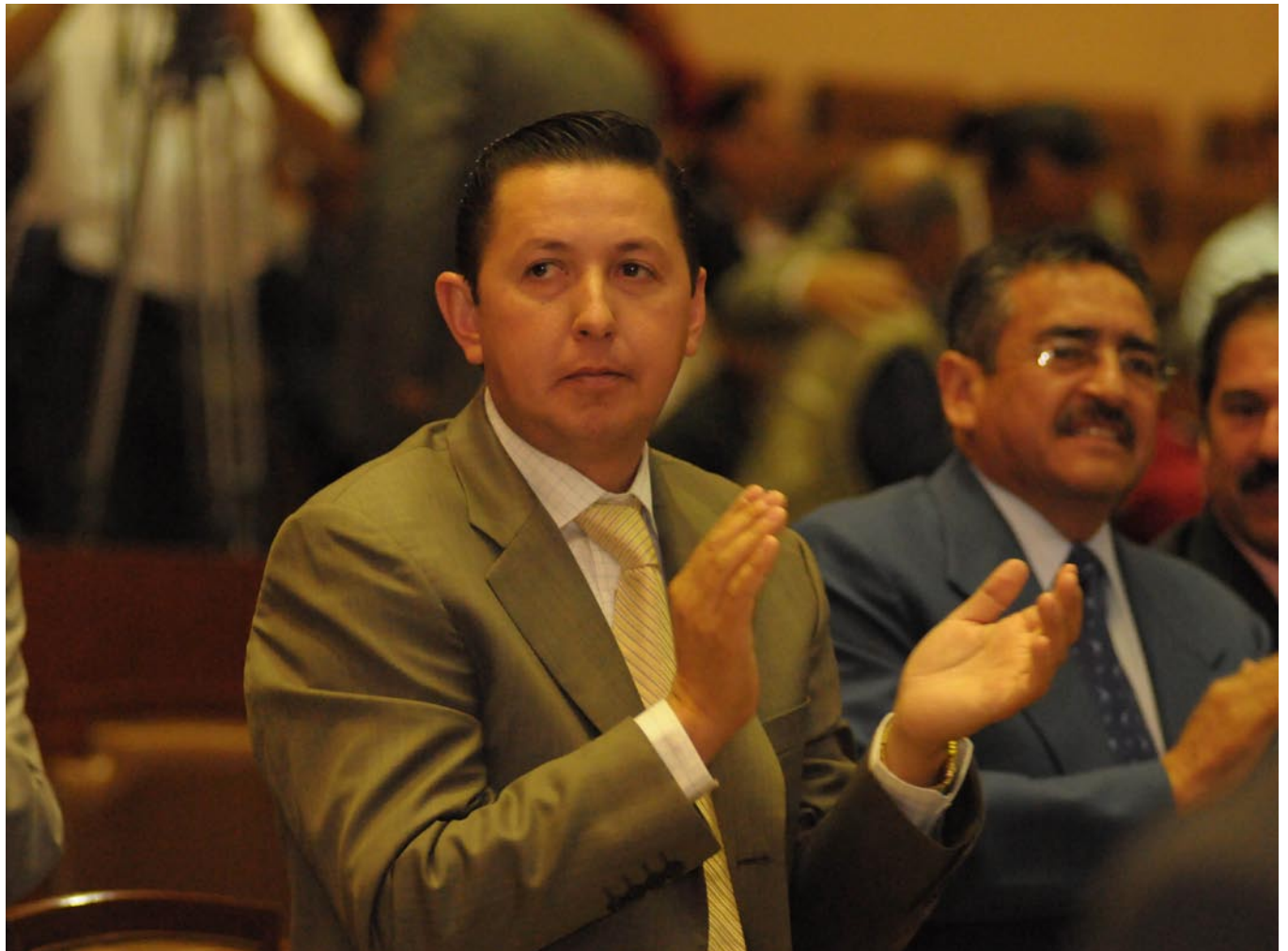
Diputado Salvador Barajas del Toro - Distrito XIX.

Como parte de una jornada de visitas por el Distrito XIX, el diputado local Salvador Barajas del Toro sostuvo un encuentro con el presidente municipal Anselmo Ábrica Chávez.