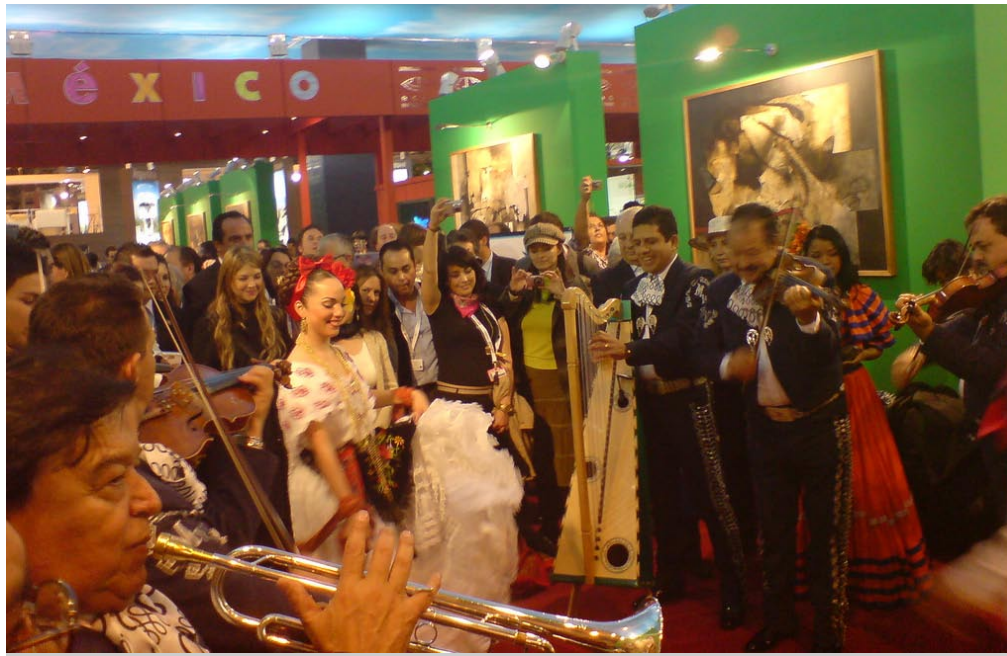
Mariachi Vargas de Tecalitlán.

Donde se desprenden una serie de festividades de índole religioso y cultural.