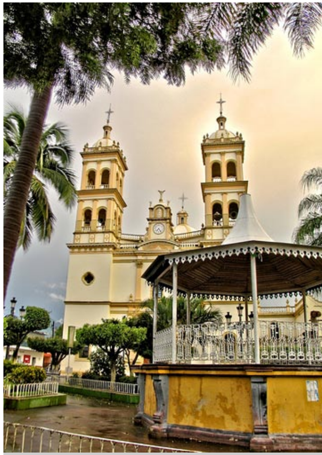
Ejemplo de Plaza tradicional en Jalisco.