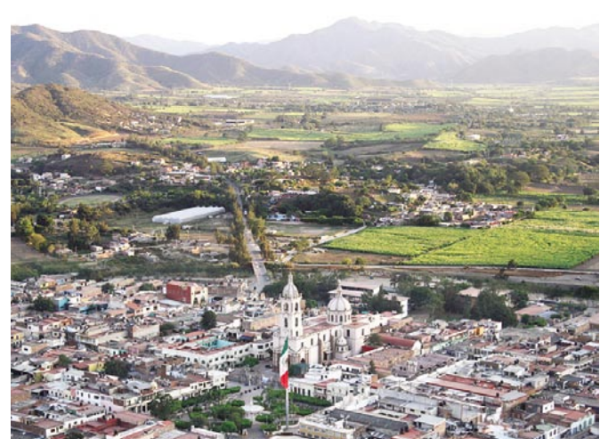
Panorámica de Tamazula, Jalisco.