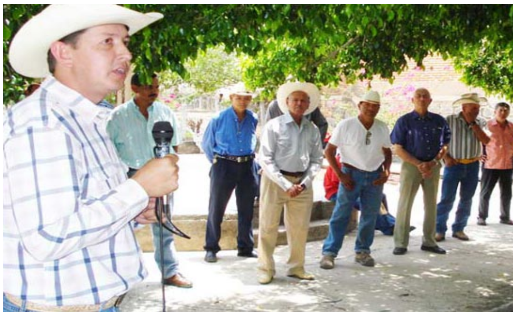
Fotogalería del periódico del Sur de Jalisco.