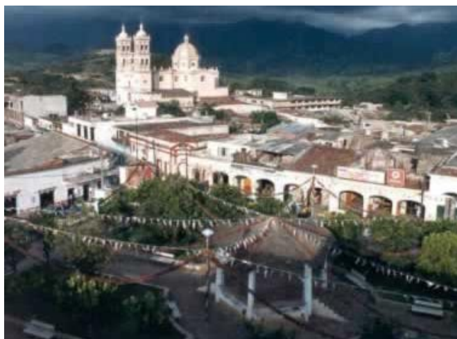
Panorámica de Pihuamo, Jalisco.

La Plaza Cívica, decorada con una escultura de bronce con la figura de un águila devorando una serpiente y una asta de bandera de siete metros de alto. El espacio sirve como marco para eventos cívicos del municipio y se encuentra frente al Palacio Municipal.