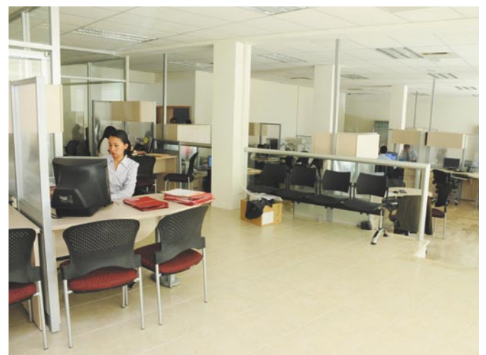
Nuevas instalaciones para brindar una mejor atención a los ciudadanos jaliscienses.