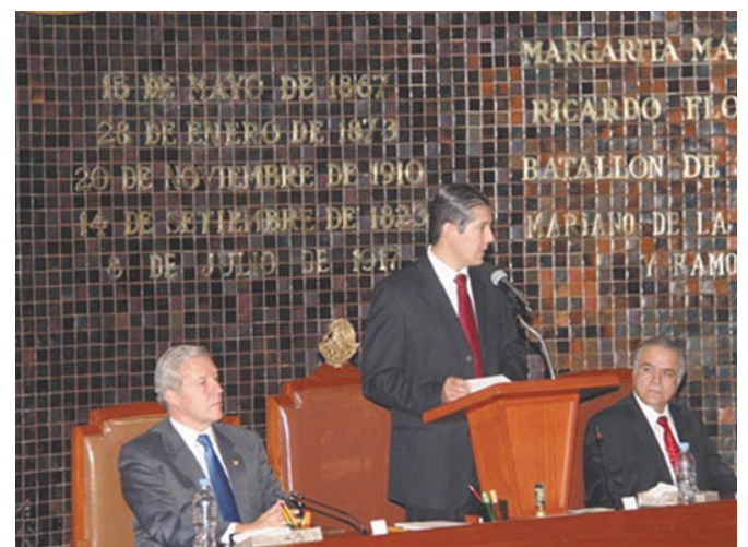
Congreso del Estado de Jalisco en sesión.