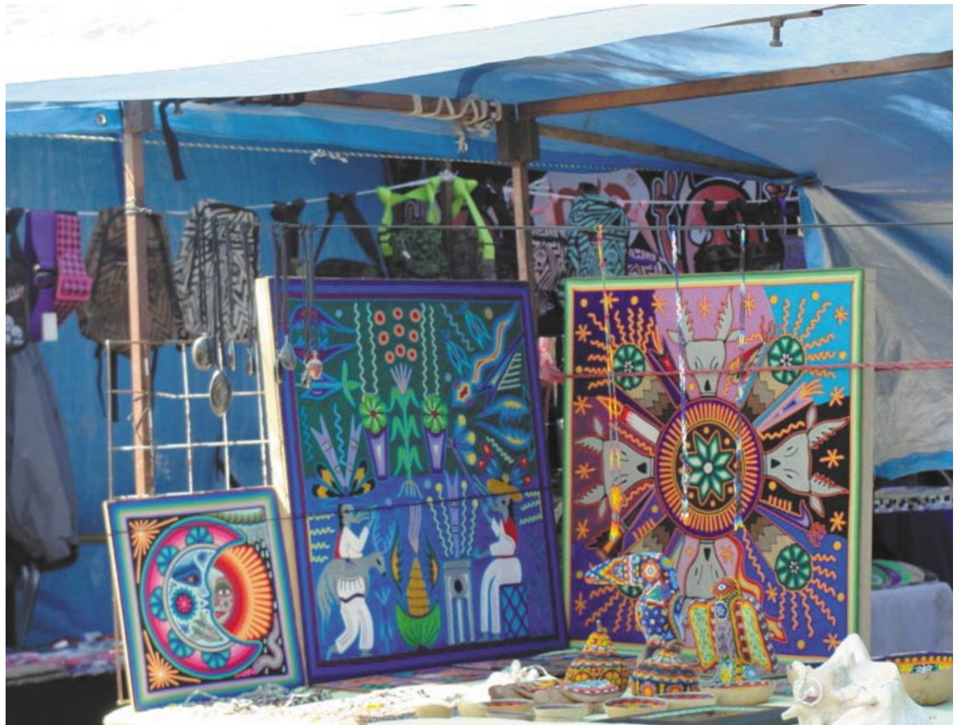
En GDL hay 21 mercados ambulantes, donde se pueden encontrar artículos sumamente variados.

Tianguis (del náhuatl tianquiztli 'mercado') es el mercado tradicional que ha existido en Mesoamérica desde época prehispánica, y que ha ido evolucionando en forma y contexto social en los años.