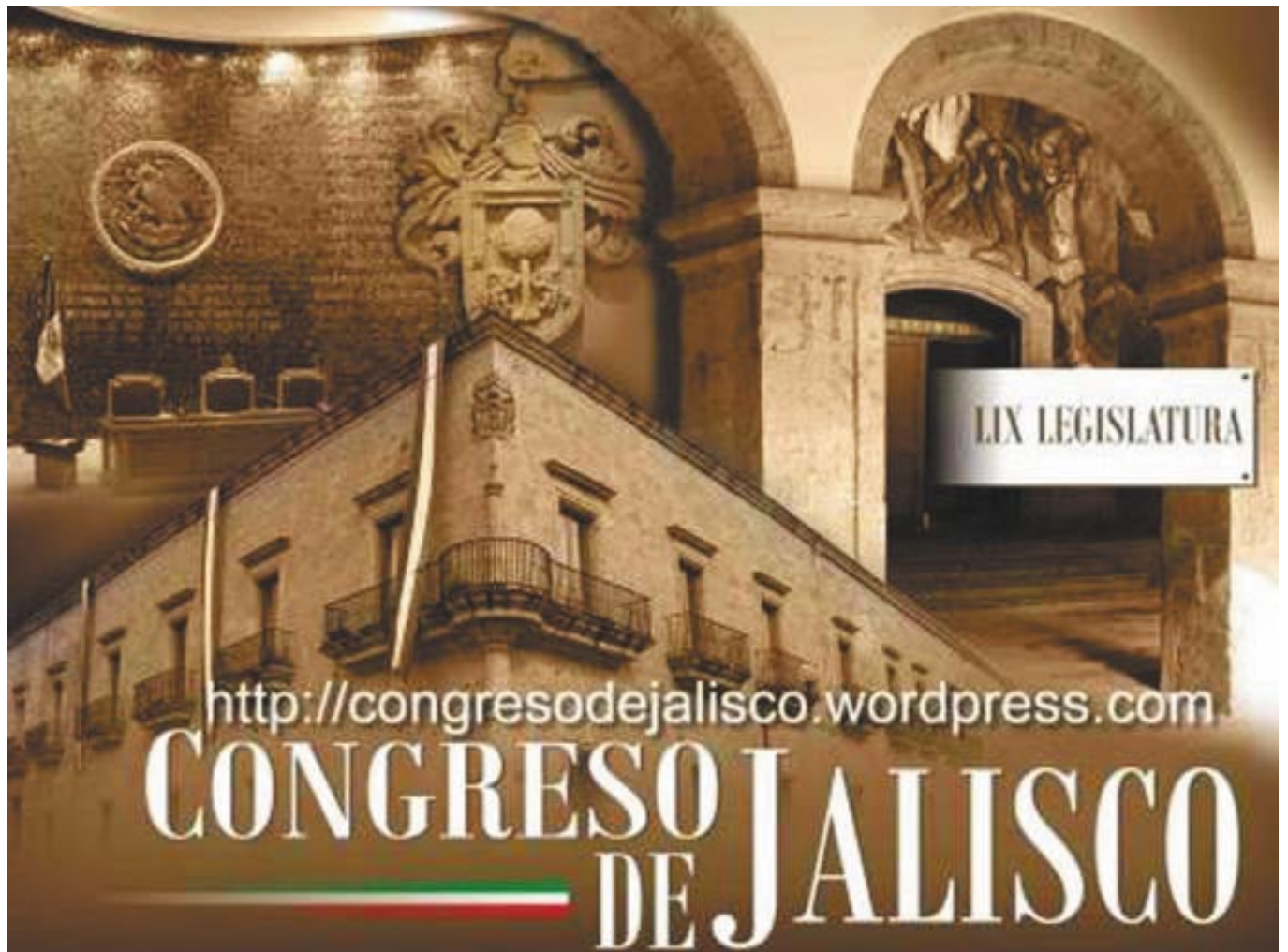
Congreso del Estado de Jalisco.

Analizamos detalladamente los principales medios informativos comunitarios del estado, para extraer notas periodísticas, impresas, de la radio, en video de los noticieros de la TV local, además de comentaristas en Internet que hacen referencia al trabajo legislativo cotidiano y particular de cada congresista. Nuestro equipo de trabajo está compuesto de varios analistas que recopilan información y la clasifican en forma detallada en un blog especializado en cada uno de los Legisladores.