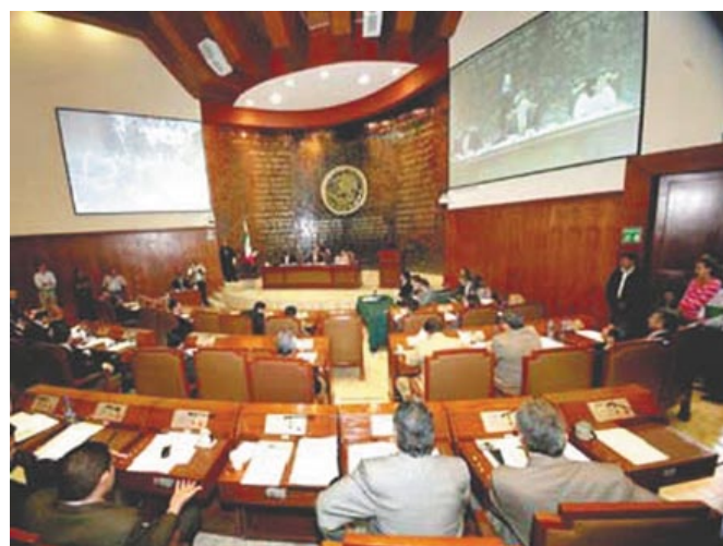
Pleno del Congreso del Estado de Jalisco.