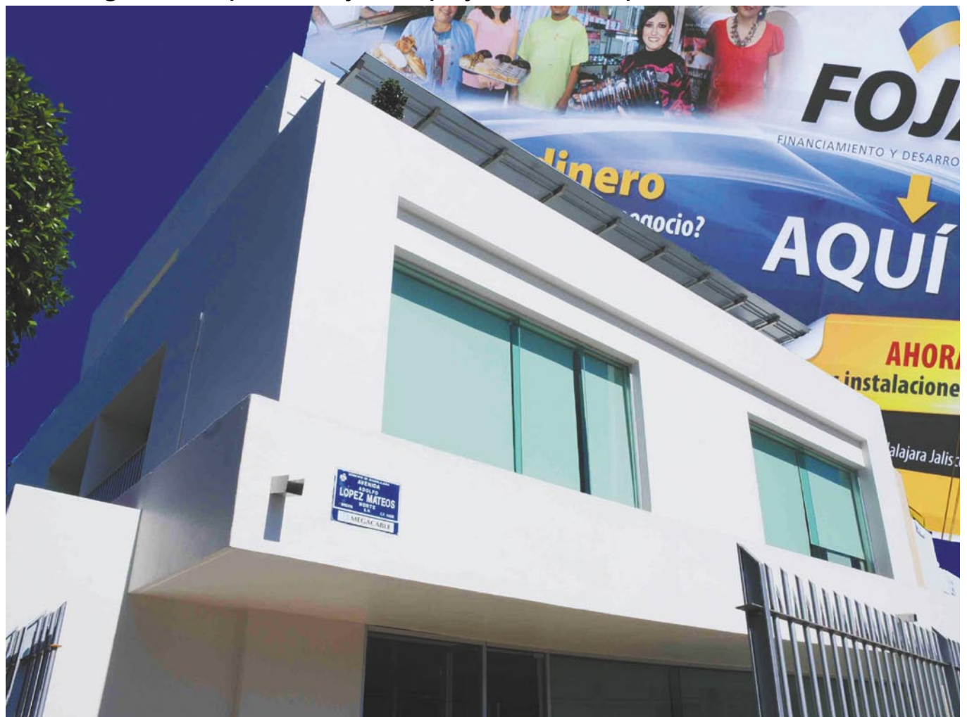
Nuevo domicilio Av. López Mateos 1135 Esquina Calle Colomos Fracc. Italia Providencia.

Fomento Jalisco ofrece sus nuevas e impecables instalaciones a la comunidad del Estado de Jalisco. Con renovado espíritu y nuevas estrategias comparte hoy su apoyo a los emprendedores de Jalisco.