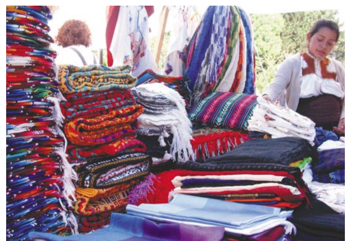
Puesto de ropa tradicional en un tianguis.