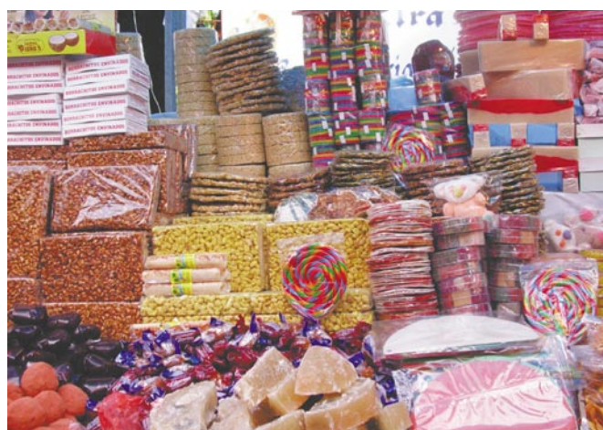
Sin duda el futuro del tianguis es seguir creciendo.