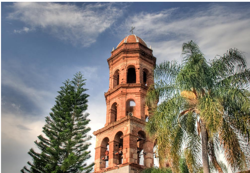
Teuchitlán forma parte de la promoción, difusión de los paquetes escenciales.

Se diseñaron los primeros nueve paquetes de la Ruta del Tequila, así como la impresión del primer catálogo de productos.