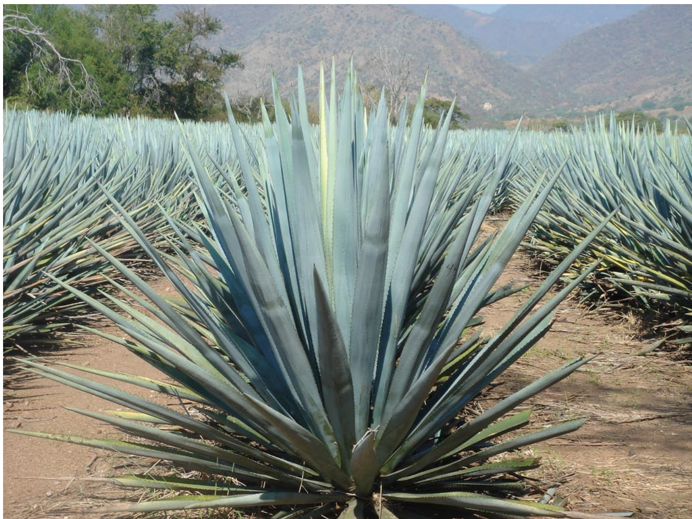
Agave azul, paisaje, destino, bebida y todo un concepto a favor de la región “Ruta del Tequila”.

El organismo ejecutor del proyecto “La Ruta del Tequila” es el Consejo Regulador del Tequila.