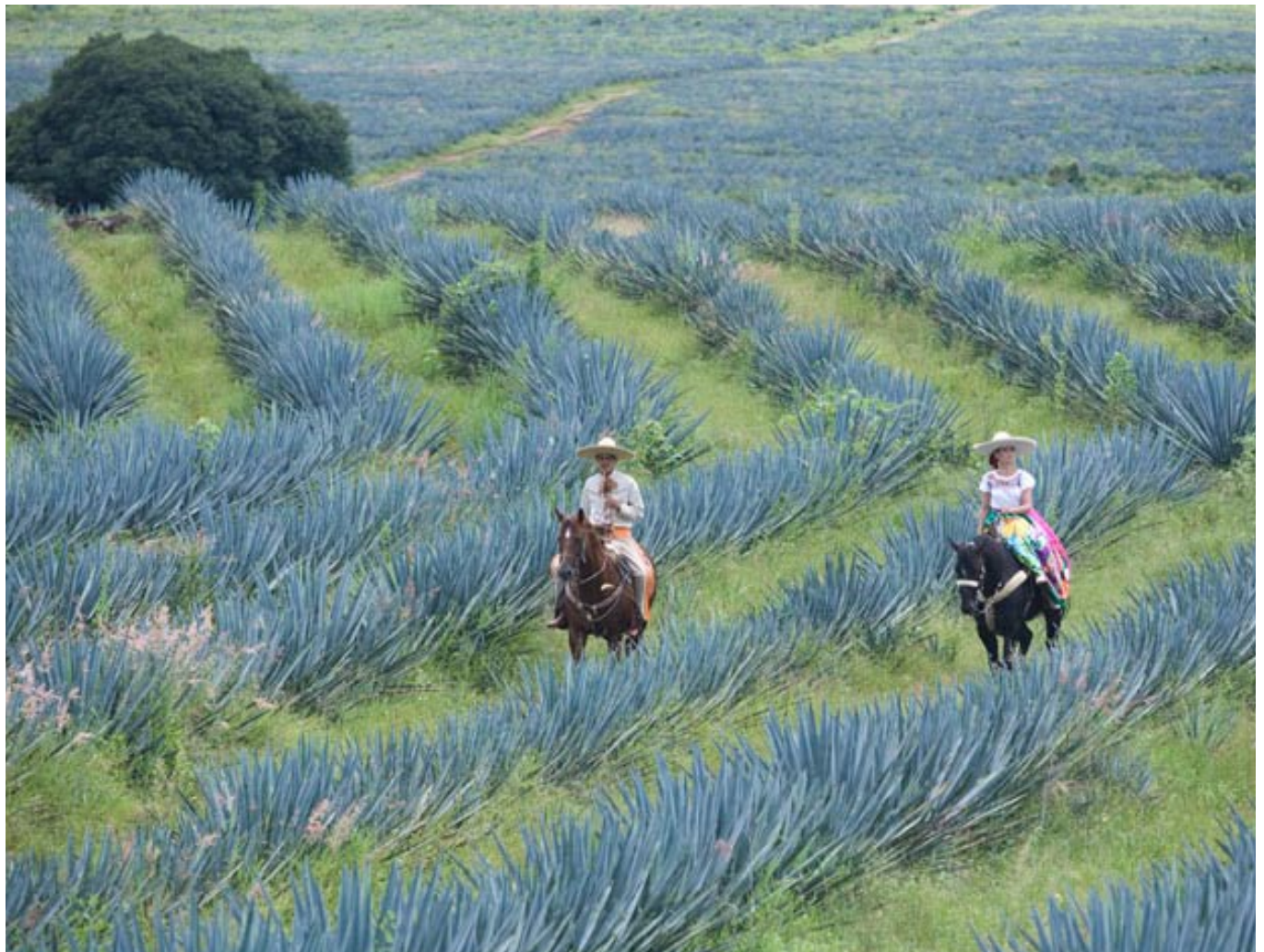
La Ruta del Tequila es un concepto que da valor a la región, a sus empresas y a sus habitantes.

Se ha logrado capacitar a 750 personas de 50 empresas turísticas, se certificó a 36 empresas con el Distintivo TT, 6 empresas de El Arenal, 3 de Amatitán, 6 de Teuchitlán y 21 empresas en Tequila.