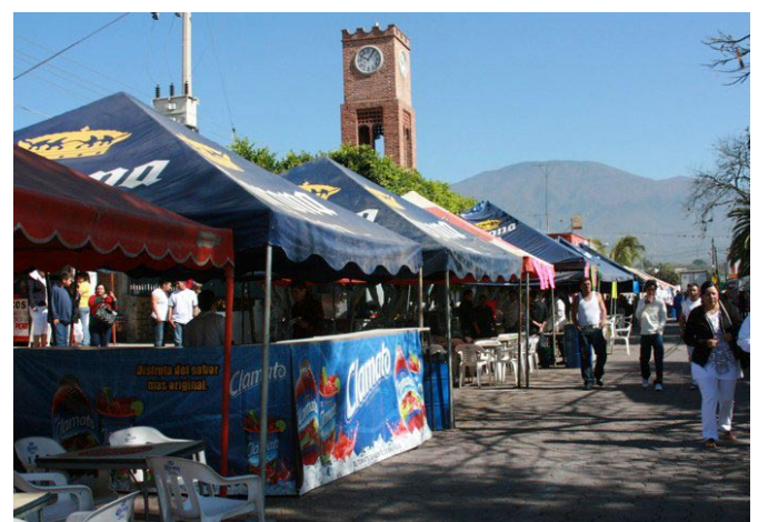
Fiesta de la Primavera en Guachimontones.