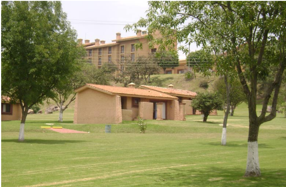
Cabañas del Hotel Villa Primavera de la Universidad de Guadalajara.