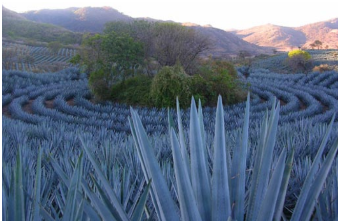
Paisaje Agavero, Patrimonio de la Humanidad.

La Ruta del Tequila se encuentra ubicada dentro de la zona de denominación de origen tequila y dentro del paisaje agavero declarado por la UNESCO patrimonio cultural de la humanidad.