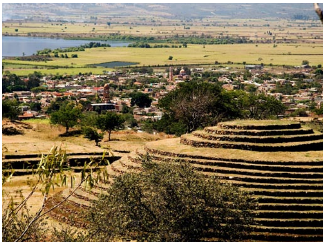
Región de Guachimontones.

Es un proyecto importante porque conjunta dos sectores importantes para el BID: el sector turismo, que es de los que tienen mayor impacto en la generación de empleo, y el otro es el sector de desarrollo microempresarial.