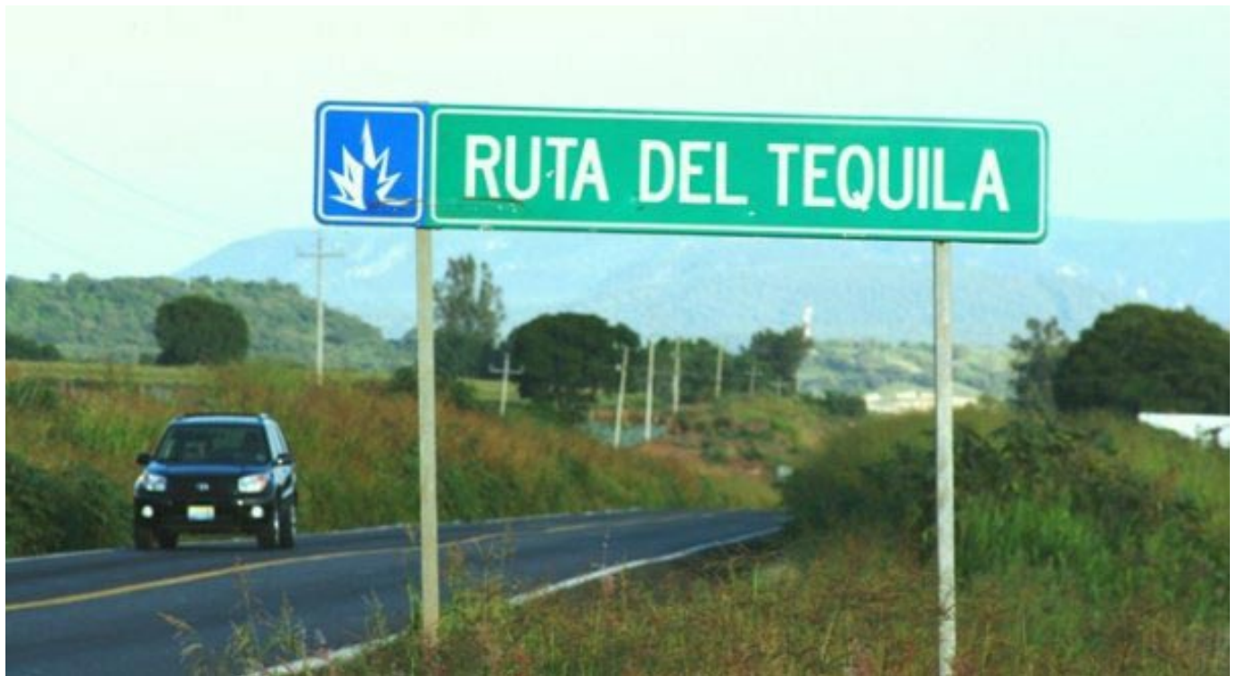
Señalamiento en carreteras para orientar y dirigir al visitante.

Se comenzó el proyecto de formación de emprendedores por parte de la Ruta del Tequila en conjunto con el TEC de Tequila, con un valor de 551 mil pesos, de los cuales la Ruta aportó 46 mil; este programa incluye la formación y elaboración de planes de empresas, de ellos los mejores 13 proyectos serán apoyados por la incubadora del TEC.