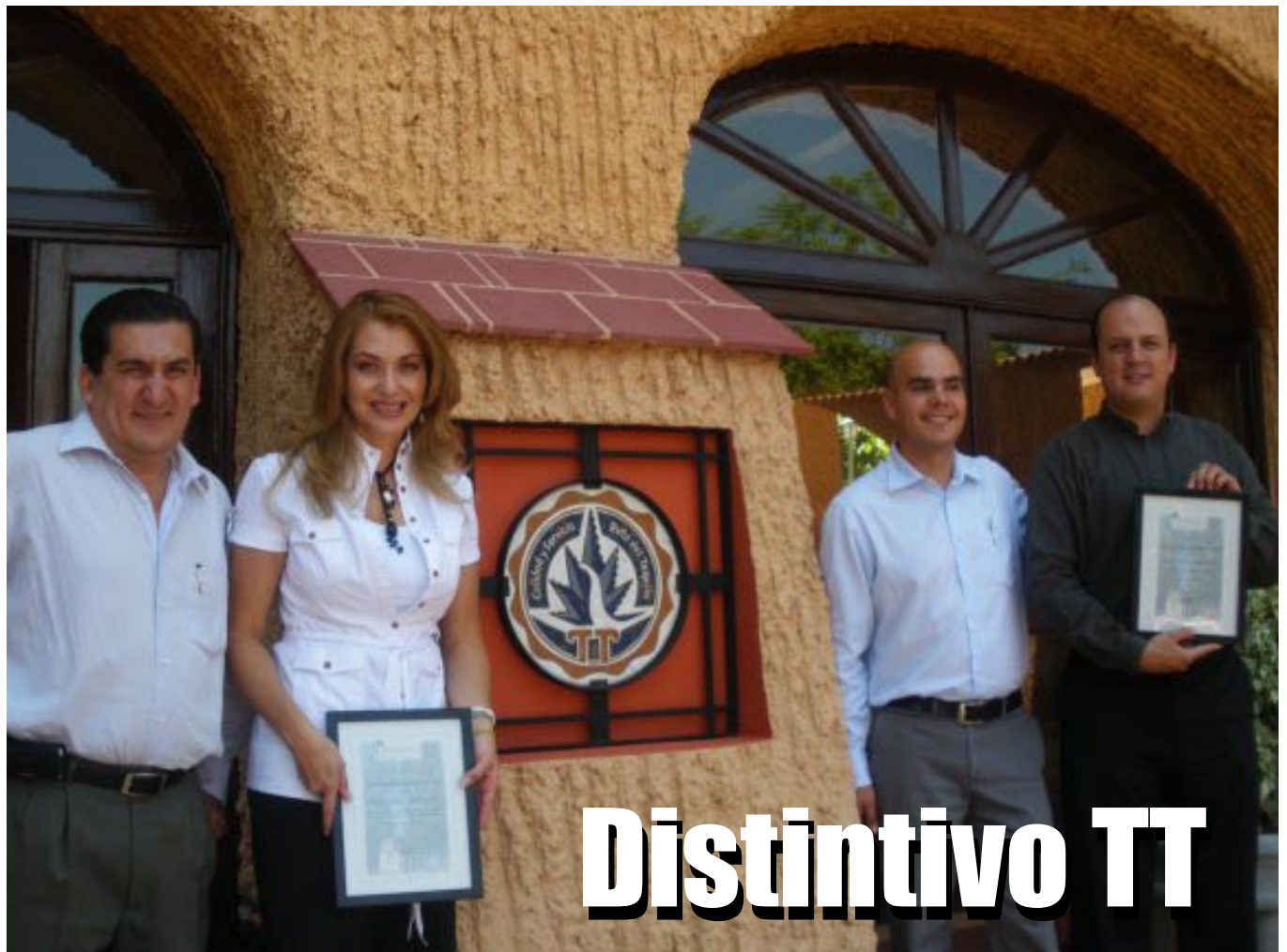
Placa Distintivo TT en el Hotel Villa Primavera.

Reconocimiento que el Consejo Regulador del Tequila otorga a las empresas que cumplen con estándares de calidad en sus productos y servicios difundiendo la riqueza patrimonial de la Ruta del Tequila.