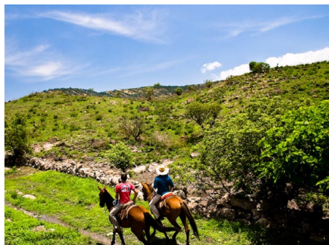
Caminos de Jalisco.