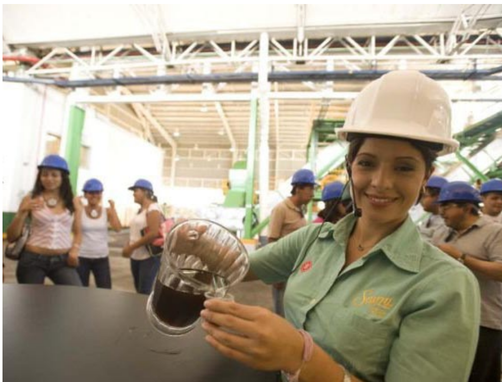
El distintivo esta abierto a todos los prestadores de servicios al visitante.

Los turistas, visitantes, operadores mayoristas y agencias de viajes buscan adquirir productos y servicios con calidad y con un alto nivel de beneficio emocional, por lo que el Distintivo TT les permitirá a los establecimientos asegurar estos elementos claves en la compra y goce de un destino turístico.