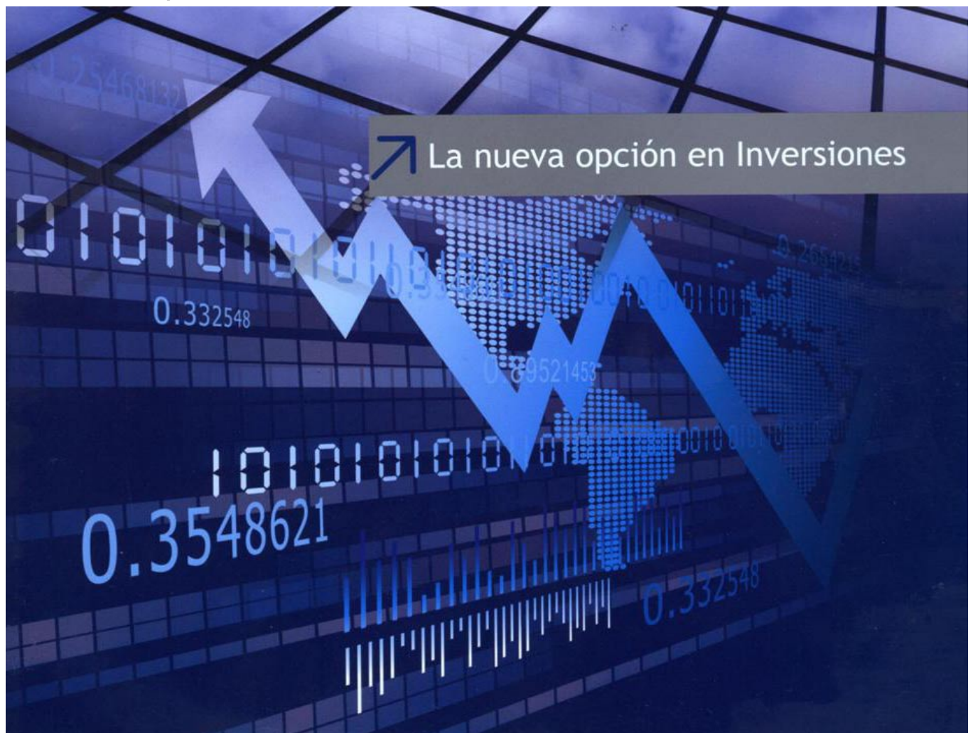
Hoy en México SOMOZA FINAMEX tiene presencia en México, Monterrey y Guadalajara.

La conformación de portafolios se realiza buscando la mejor diversificación posible de monedas o instrumentos financieros de acuerdo al perfil de cada cliente.