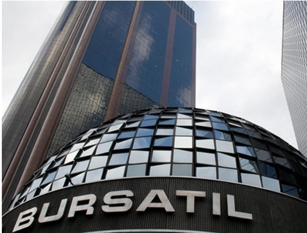
Bolsa Mexicana de Valores.

La Bolsa Mexicana de Valores, S.A.B. de C.V. es una entidad financiera, que opera por concesión de la Secretaría de Hacienda y Crédito Público, con apego a la Ley del Mercado de Valores.