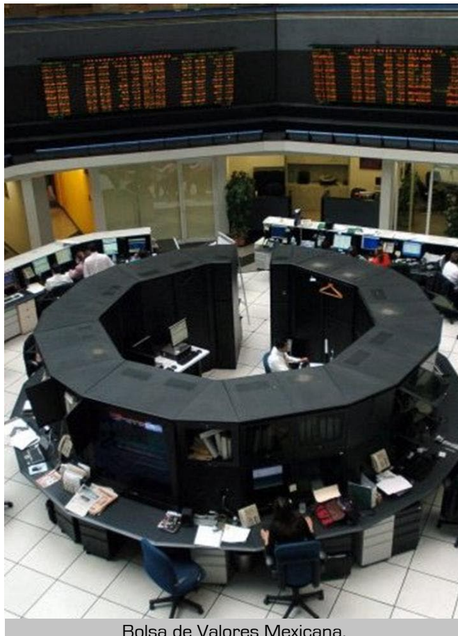
Bolsa de Valores Mexicana.

La palabra "bolsa" tiene su origen en un edificio que perteneció a una familia noble en la ciudad europea de Brujas, de la región de Flandes, de apellido Van Der Buërse, donde se realizaban encuentros y reuniones de carácter mercantil.