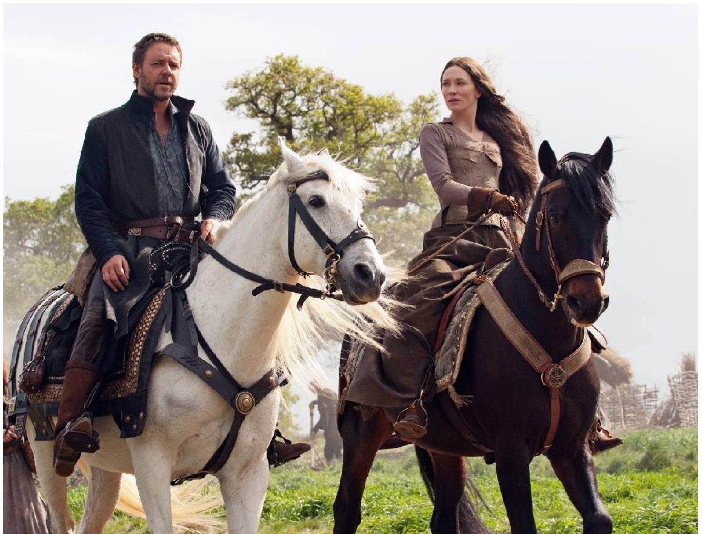
Russell Crowe como Robin Hood y Cate Blanchett como La doncella Marion.

Un filme de acción y aventura que relata la vida de un experto arquero, previamente interesado sólo en la propia conservación de su servicio en el ejército del rey Ricardo contra los franceses.