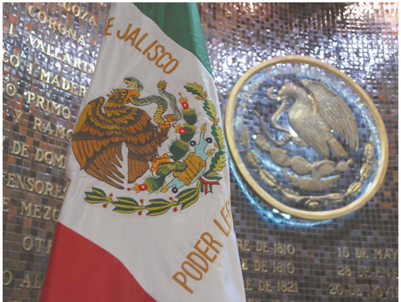
Trabajo Legislativo sustentado en el Instituto de Investigación y Estudios Legislativos.

La tendencia a criticar el desempeño de las legislaturas y el papel de los diputados es tan recurrente, que ya se volvió parte de nuestra cultura.