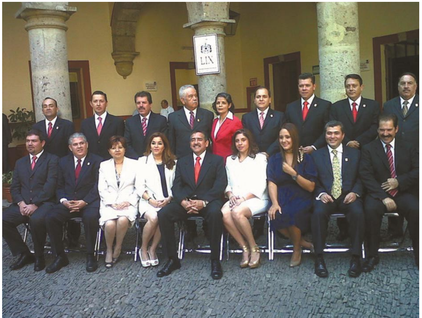
Fracción del PRI Y PANAL que conforman la LIX Legislatura de Jalisco.

Bajo las siglas de www.diputadosjaliscopri.org.mx la fracción parlamentaria de la LIX Legislatura del estado de Jalisco ofrece una plataforma más de consulta y transparencia hacia la comunidad.