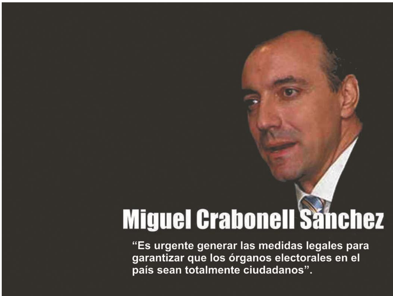
Miguel Carbonell Sánchez

Miguel Carbonell, es una referencia obligada en siglo XXI para todo tipo de temas constitucionales. Esta vez se desarrolló en el marco de su visita en forma trivial algunas visiones de los esquemas electorales del país, de los estados, de los avances y retrocesos en la democracia; se habló de la urna electrónica para bien, de los huecos que contempla la constitución en materia de fuero y desafuero. Hay una pragmática forma de exhibir a los partidos, a los legisladores de las dos cámaras principales del país (Senadores y Diputados).