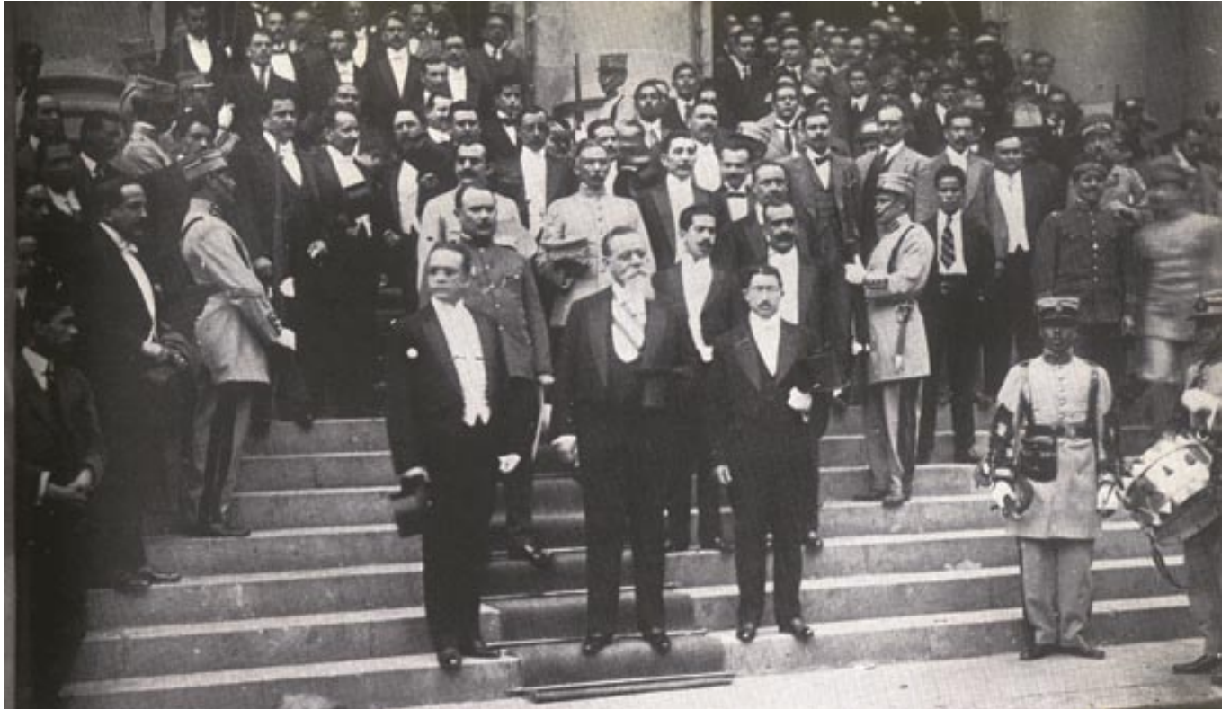
El presidente Carranza saliendo de la Cámara de Diputados, después de haber otorgado la protesta como presidente de República; lo acompañan los generales Álvaro Obregón, Pablo González, Manuel M. Diéguez, Emiliano P. Navarrete, Francisco Múgica, Eduardo Hay y otros.

El 8 de julio de 1914, con Álvaro Obregón al frente, las fuerzas constitucionalistas desplegaron mismo su triunfalismo demostrando su ánimo anticlerical. El avance había transcurrido por la costa del Pacífico, donde las fuerzas de vanguardia de Manuel Diéguez, Rafael Buelna y Lucio Blanco habían abierto el camino después de apoderarse de Acaponeta, San Blas y Tepic.