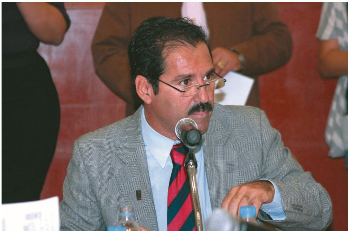
Dip. Jesús Casillas Presidente la Puntos Constitucionales.

Aprueban elevar Iniciativas de Ley al Congreso de la Unión. En sesión de trabajo, la Comisión de Puntos Constitucionales, Estudios Legislativos y Reglamentos aprobó hoy que la LIX Legislatura del Estado eleve iniciativas al Congreso de la Unión para solicitar que se reforme la Ley Federal de Armas y Explosivos buscando que el armamento asegurado a la delincuencia organizada sea donado a las corporaciones policíacas.