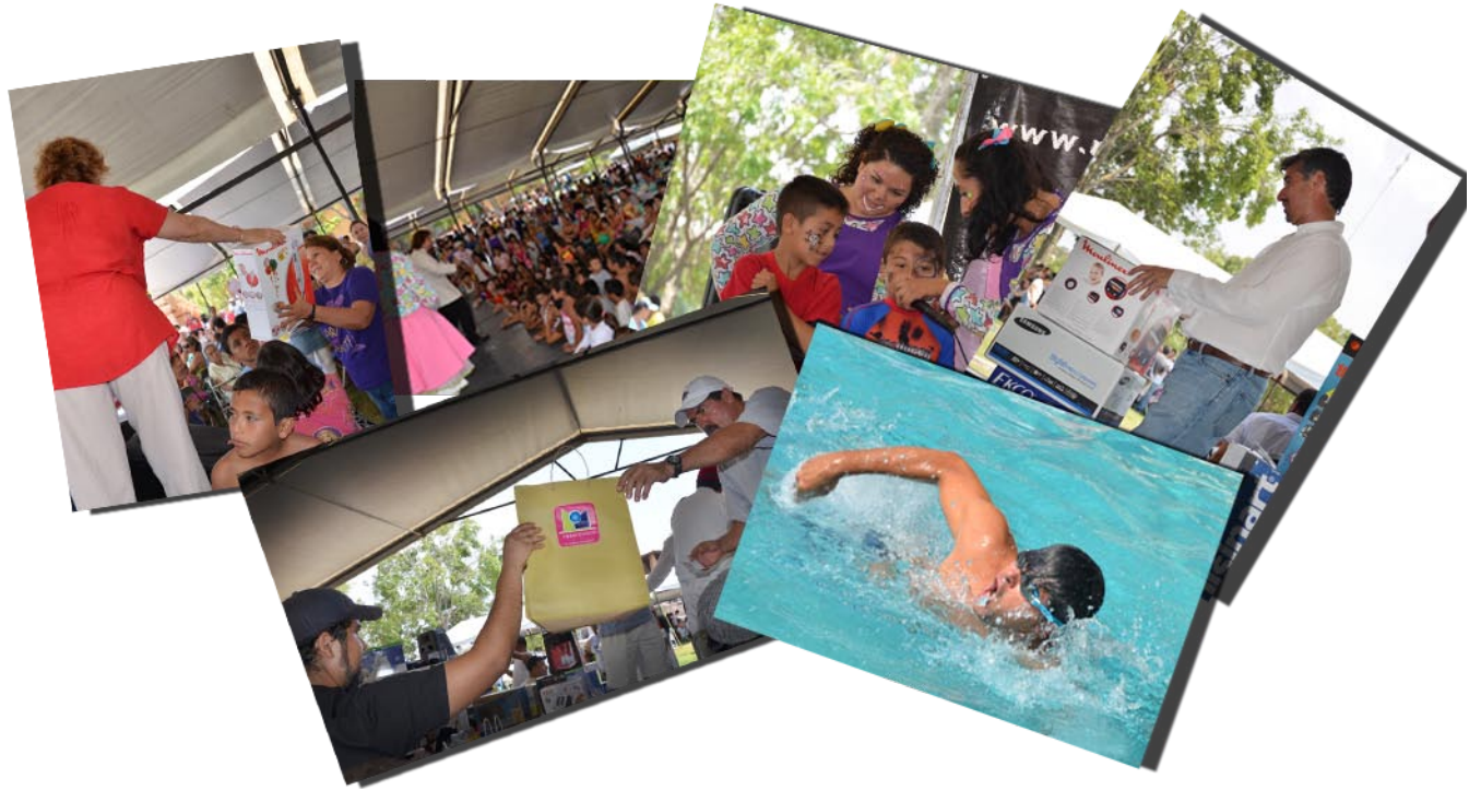
Imágenes de las actividades realizadas el Día del Académico.