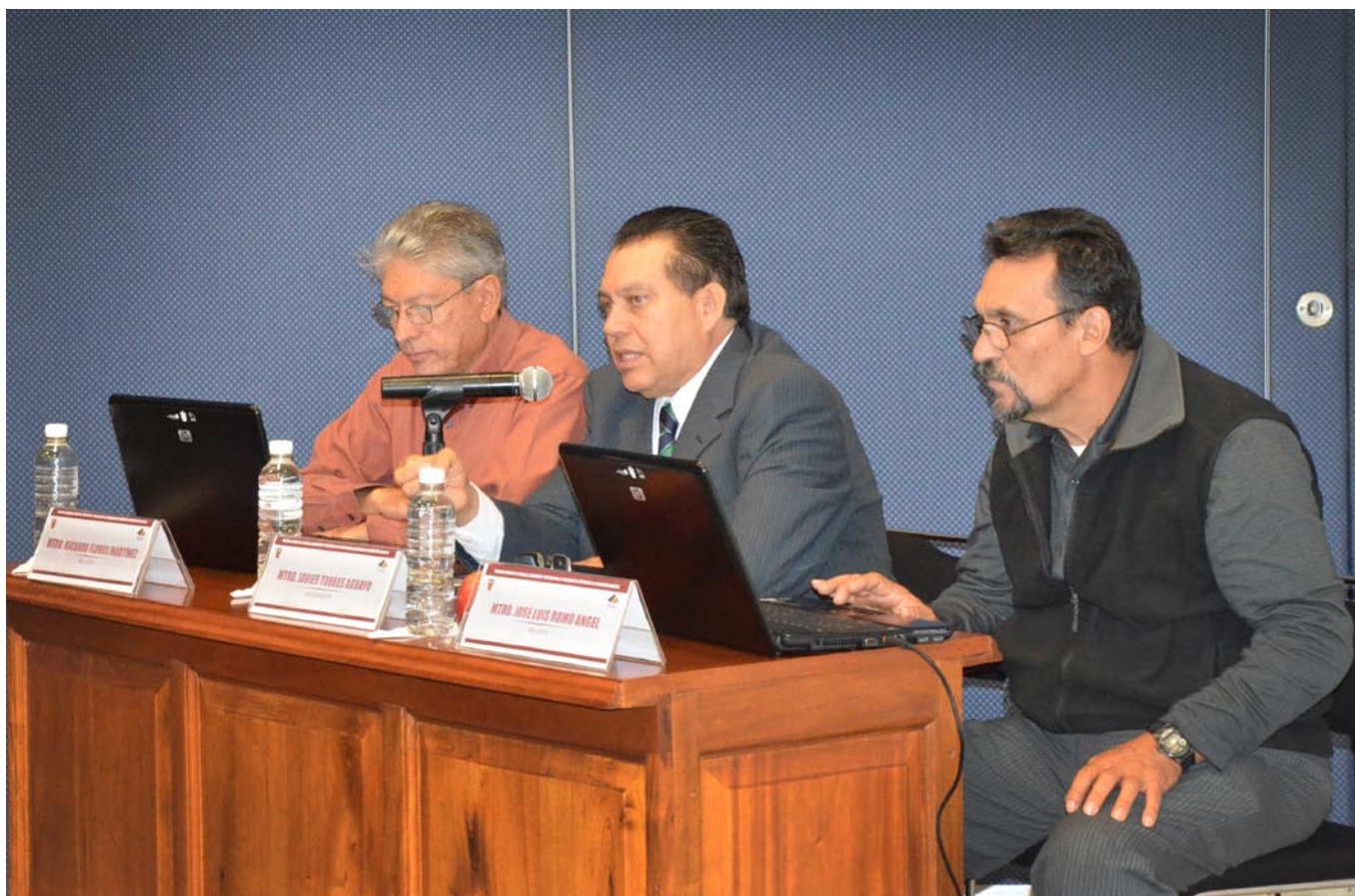
Imágenes de la primera reunion celebrada en el CUSur.

El Sindicato de Trabajadores Académicos de la Universidad de Guadalajara realizó una serie de reuniones con delegados de toda la red universitaria para discutir y proponer mejoras a los lineamientos del Programa de Estímulos al Desempeño Docente (PROESDE).