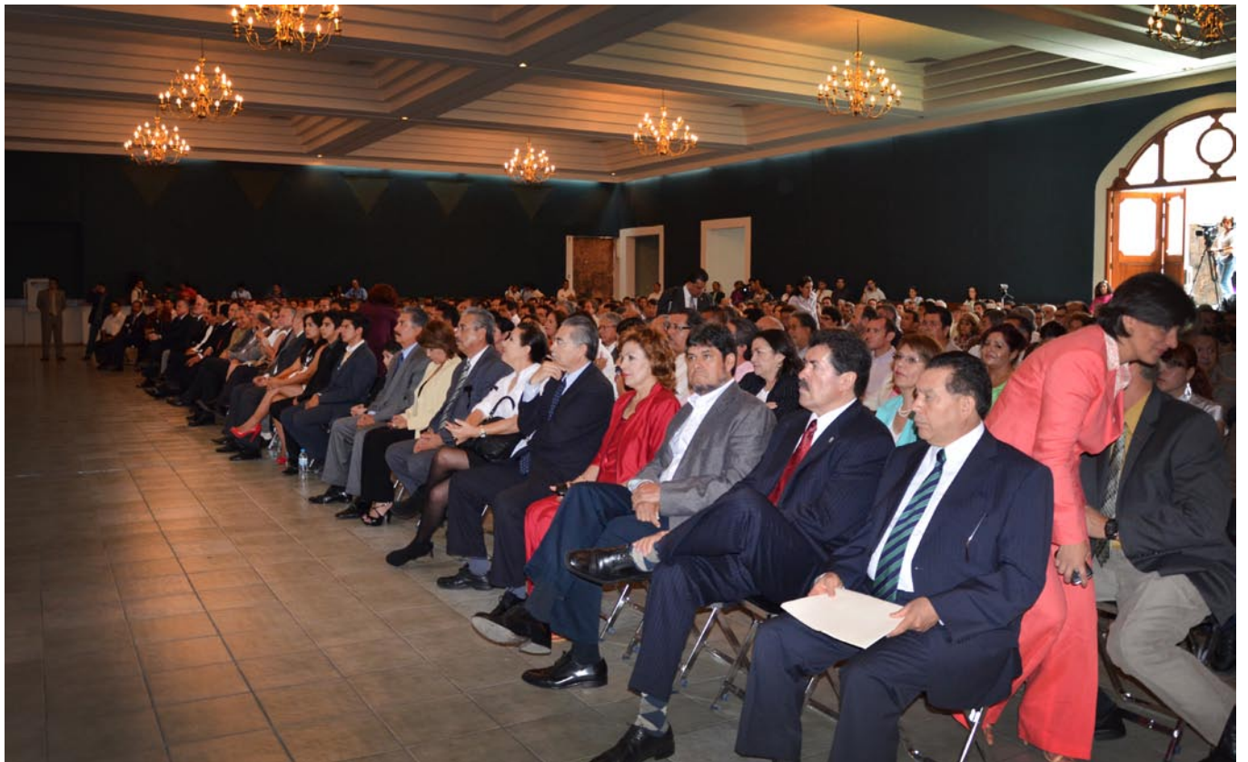
Asistentes a la toma de protesta del nuevo Secretario General.