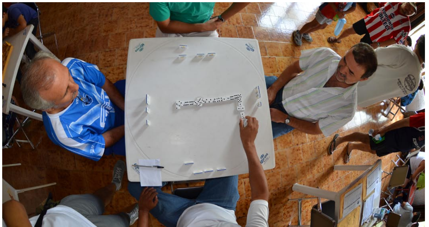
Académicos en el torneo de domino.