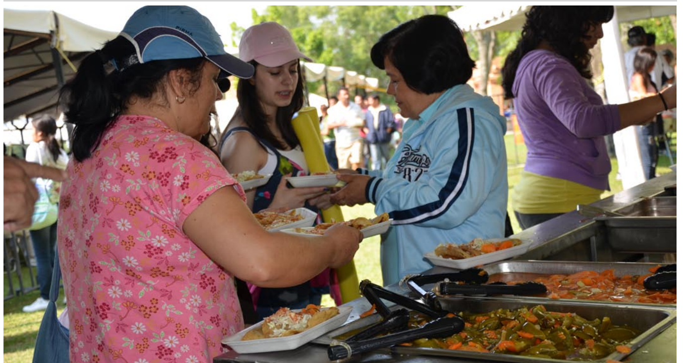
El evento se llevó acabo en el Club Deportivo de la UdeG.