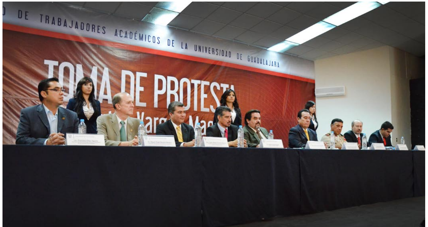
Presidium durante la toma de protesta del nuevo Secretario General del STAUdeG.