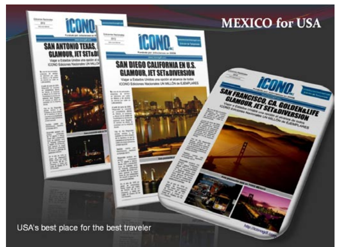
USA's best place for the best traveler