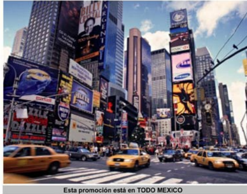
Esta promoción está en TODO MEXICO

En el año de 1978 un grupo de empresarios formó Visión por Cable de Sonora, SA de CV (Vicasa), y Visión por Cable de Sinaloa SA de CV (Vicasa).