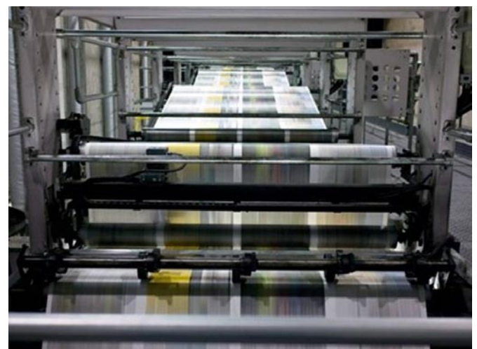
La magia de la Rotativa.