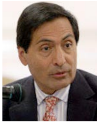
Rogelio Ramírez de la O. Secretaría de Hacienda y Crédito Público