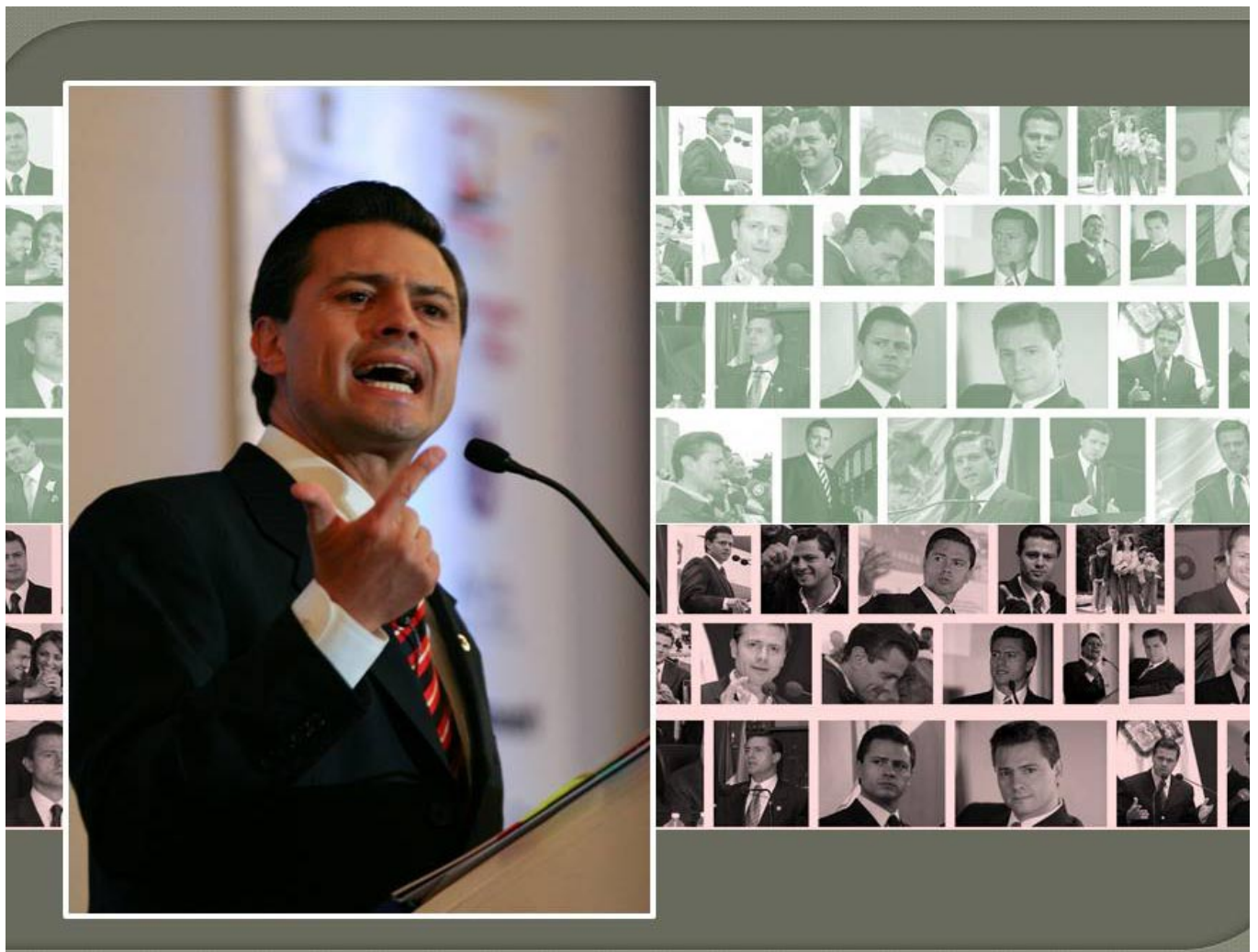
Enrique Peña Nieto un modelo de estructura, de partido y de sistema.

En 1993 se casó con su primera esposa Mónica Pretelini con quien procreó tres hijos. En 2007 Pretelini falleció por una crisis epiléptica que le ocasionó una arritmia cardiaca. En 2008, Peña Nieto anunció públicamente en un programa de televisión su noviazgo con la actriz, Angélica Rivera. El 27 de noviembre de 2010 contrajeron nupcias en la Catedral de Toluca. El 27 de noviembre de 2011, Peña Nieto acudió a la sede nacional del PRI, para entregar la documentación y recibir la constancia que lo acredita como precandidato de Partido Revolucionario Institucional, con miras a las elecciones presidenciales del 2012. El 17 de Diciembre, Enrique Peña Nieto recibió la constancia como candidato único del PRI.