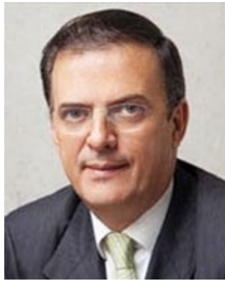
Marcelo Ebrard Casaubon Secretaría de Gobernación