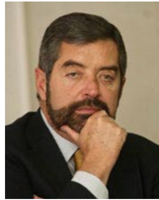
Juan Ramón de la Fuente Ramírez Secretaría de Educación Pública