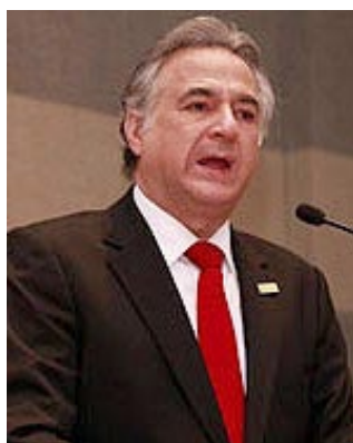
Miguel Torruco Marqués Secretaría de Turismo