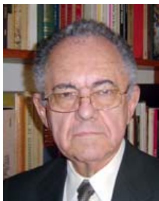
Javier Jiménez Esprú Secretaría de Comunicaciones y Transportes