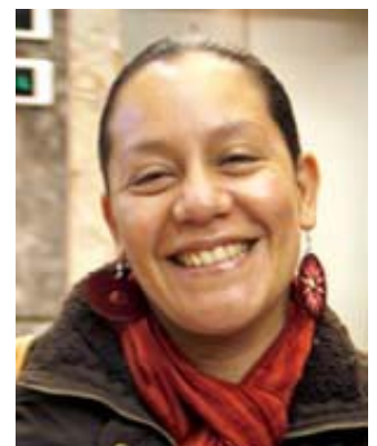
María Luisa Albores González Secretaría de Reforma Agraria