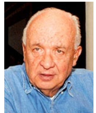
José Agustín Ortiz Pinchetti Secretaría del Trabajo y Previsión Social