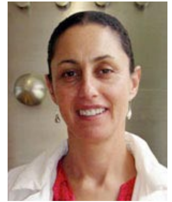
Claudia Sheinbaum Pardo Secretaría de Medio Ambiente