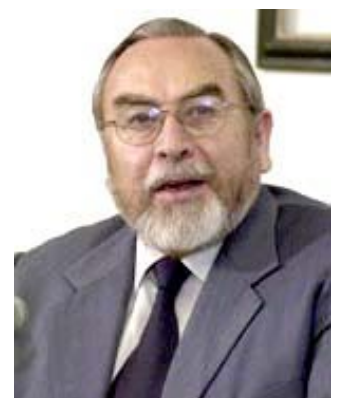
Bernardo Bátiz Vázquez Procuraduría General de la República