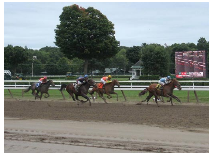
SARATOGA Springs El exótico mundo de las carreras de Caballos