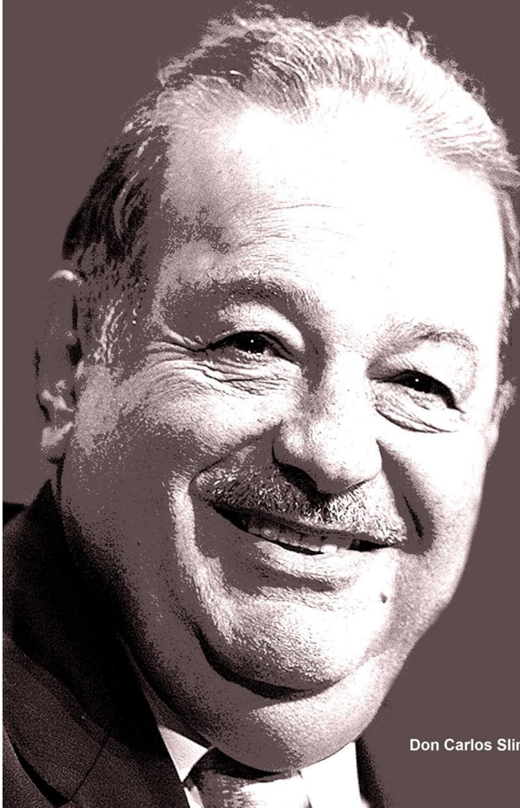
Don Carlos Slim Helú

Minera Frisco. Conformada por empresas dedicadas a la exploración y explotación de yacimientos minerales de oro, plata, cobre, zinc y plomo e integrados al desarrollo metalúrgico. Sus operaciones mineras se encuentran localizadas en los estados de Zacatecas, Chihuahua, Baja California, Aguascalientes y Sonora. www.minerafrisco.com