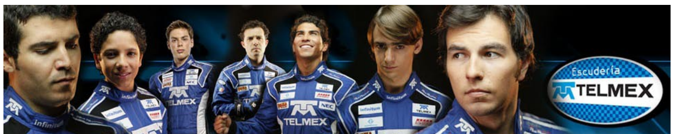
Pilotos de Escudería TELMEX.