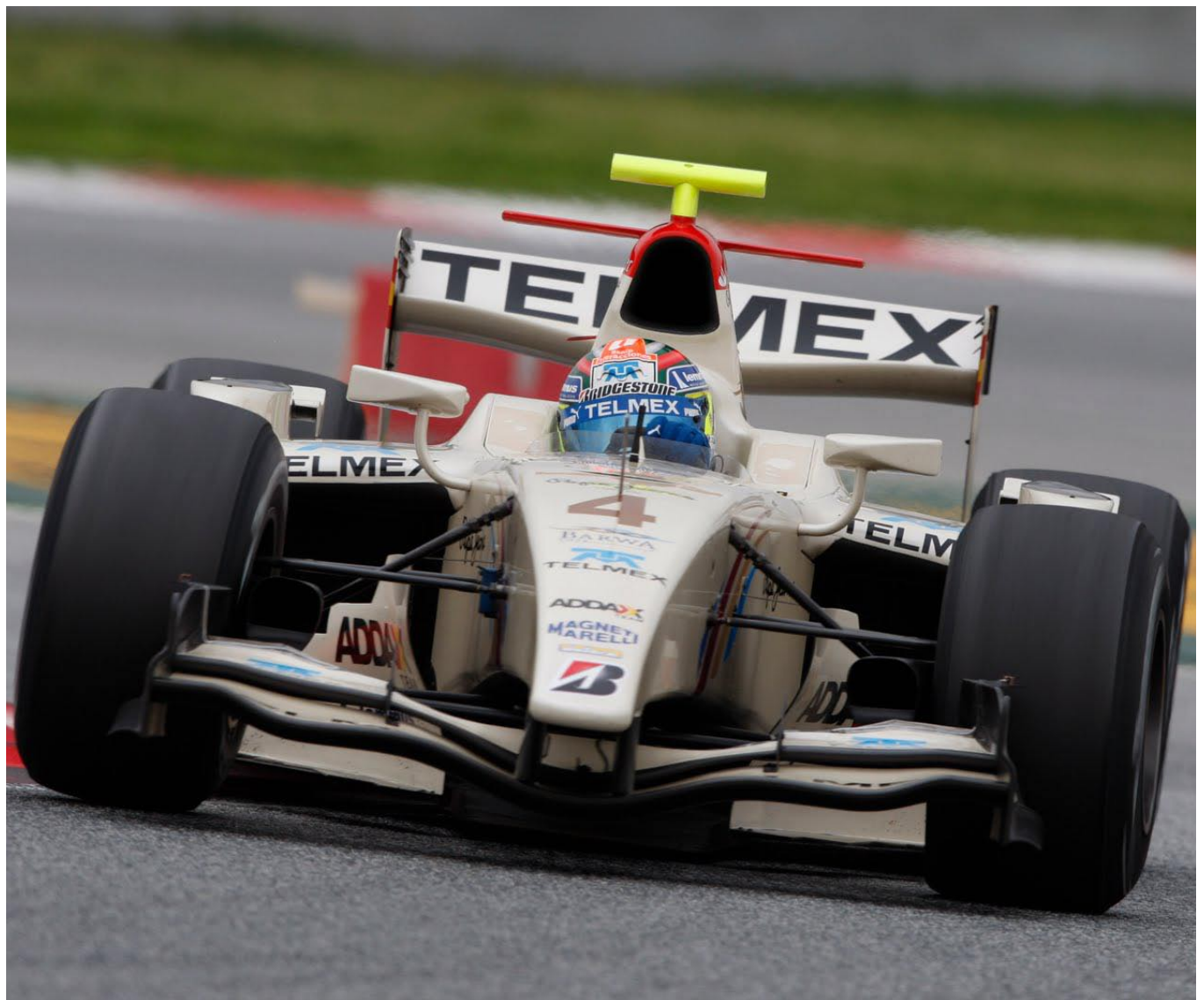
Sergio "Checo" Pérez, piloto mexicano de Fórmula Uno.

Esto, aunado al Tricampeonato en la Grand Am, al Subcampeonato en GP2, al Campeonato de GP3 y a todos los resultados previos en categorías como la F3 Británica e Italiana entre otras, ha consolidado a Escudería Telmex como el proyecto para el desarrollo de pilotos más importante en América Latina, que sigue fiel a su filosofía de impulsar a talentos nacionales para ganar carreras y campeonatos, compitiendo en las categorías más prestigiosas del automovilismo deportivo en el mundo.