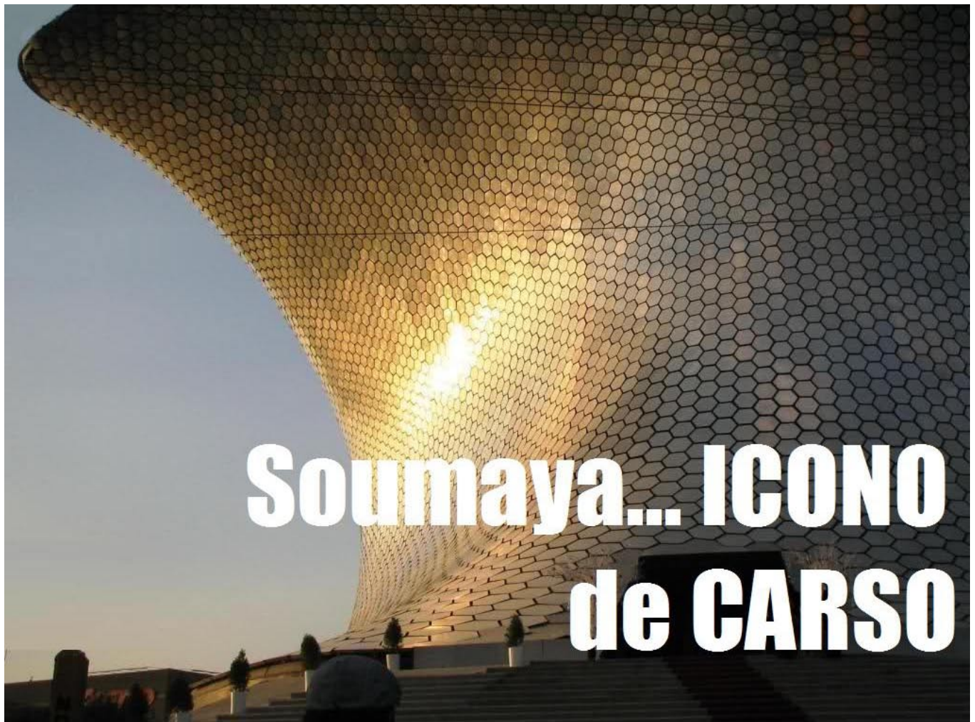
Museo Soumaya, referencia principal de Plaza & Corporativo Carso en la Ciudad de México. (Abajo) Sres. Carlos Slim Domit y Helú.

Las principales subsidiarias del ramo Comercial se encuentran agrupadas en: Grupo Sanborns, e incluye a: Sanborns Hermanos, Promotora Musical, Sears, Dorian's.