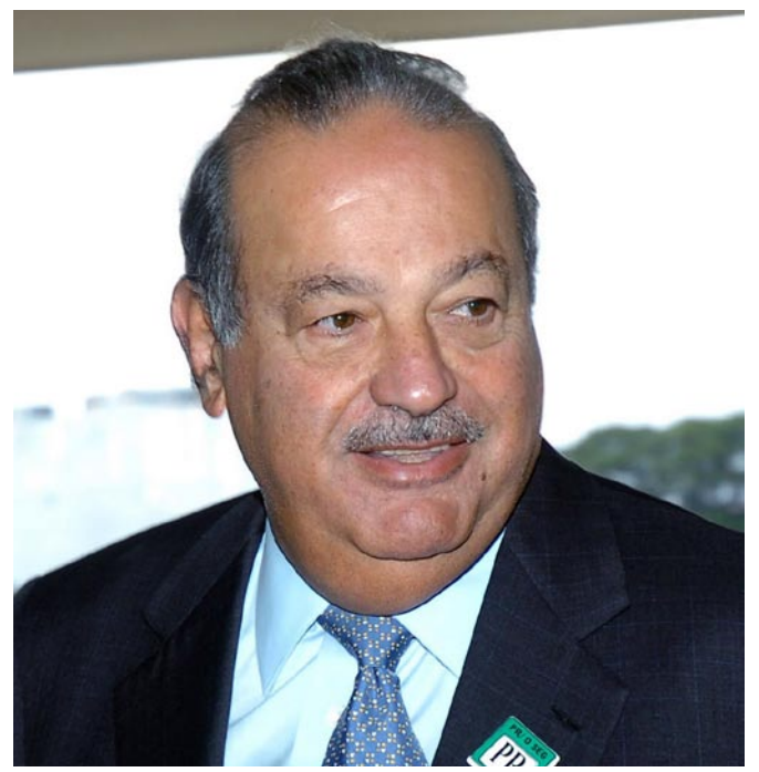
Carlos Slim Helú.

Su estilo de dirección es muy práctico, por ejemplo, en Grupo Carso no hay "staff" corporativo, cada empresa tiene su estructura pues se busca que la organización se torne más eficaz.