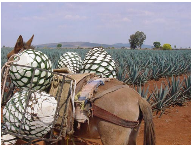
Plantación de agave, en Tequila.

La palabra tequila proviene de la lengua náhuatl Tecuilan o Tequillan, que significa "Lugar de Tributos". El Municipio se localiza casi al centro del Estado de Jalisco, ligeramente al poniente. Sus primeros pobladores fueron chichimecas, otomíes, toltecas y nahautlacas.