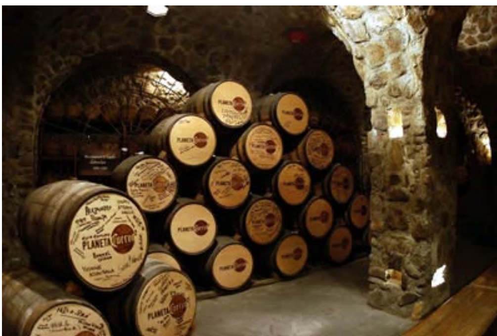
Barricas en la cava de Mundo Cuervo.

Un mundo de manos mágicas que combinan maravillosamente creatividad y pasión para dar vida a inigualables obras de arte, fascinante espectáculo que se aprecia en los diferentes talleres de textiles, cerámica, plata y tallados en piedra.