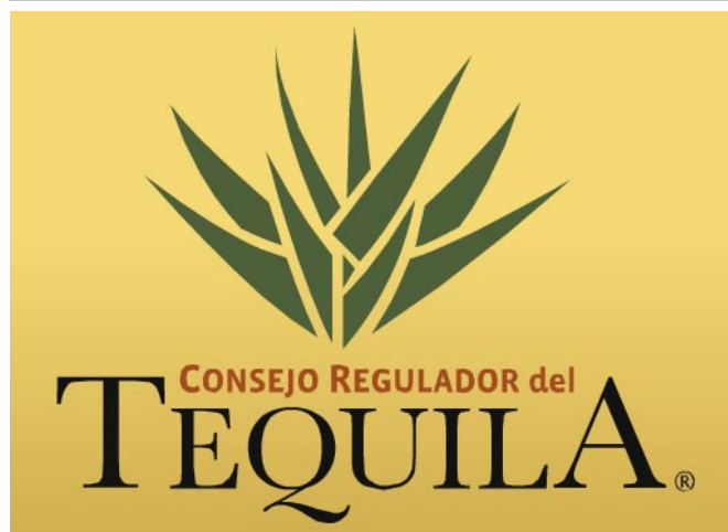
Logotipo de CRT.