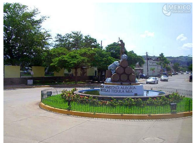
México en Foto.