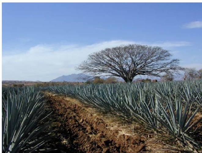
Paisaje Agavero, Patrimonio de la Humanidad.