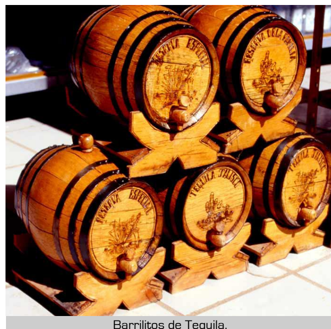
Barrilitos de Tequila.

Y como en todo nuestro México, no puede faltar la veneración el día 12 de diciembre para la Virgen de Guadalupe.