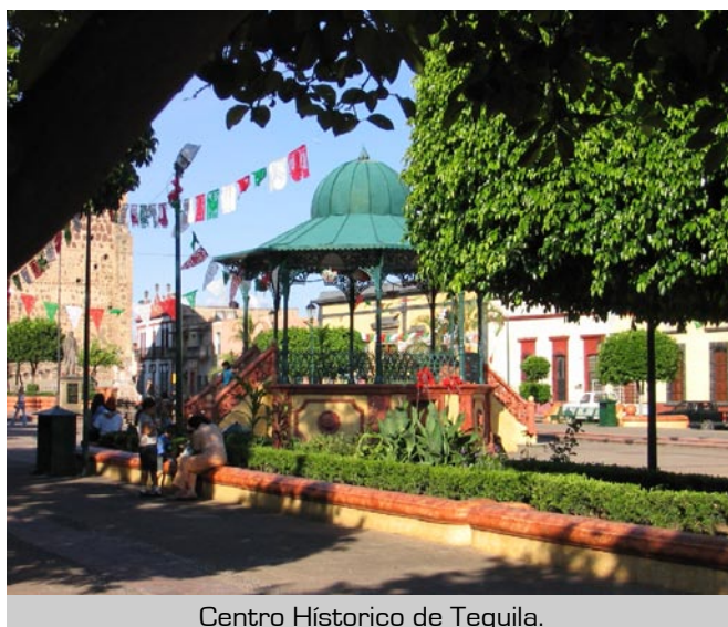
Centro Histórico de Tequila.