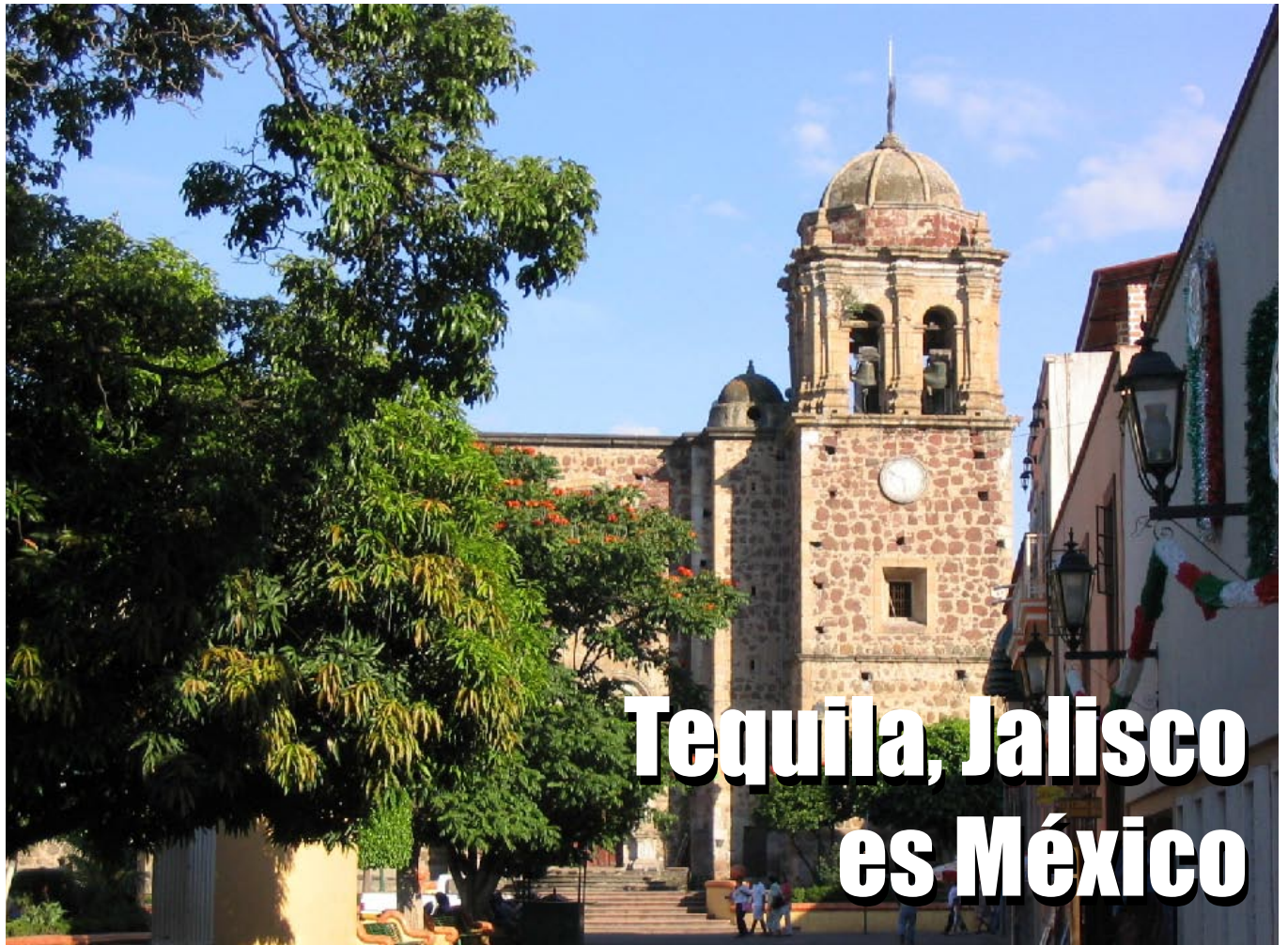
Tequila, Jalisco. Ubicado a 30 minutos de la ciudad de Guadalajara, México.

Tiene un aire de respeto, de limpieza y de agradable disposición para servir al visitante. Orgullo, trabajo, pasado, presente y futuro de un pueblo que, es el pilar del agave más afamado en el mundo.