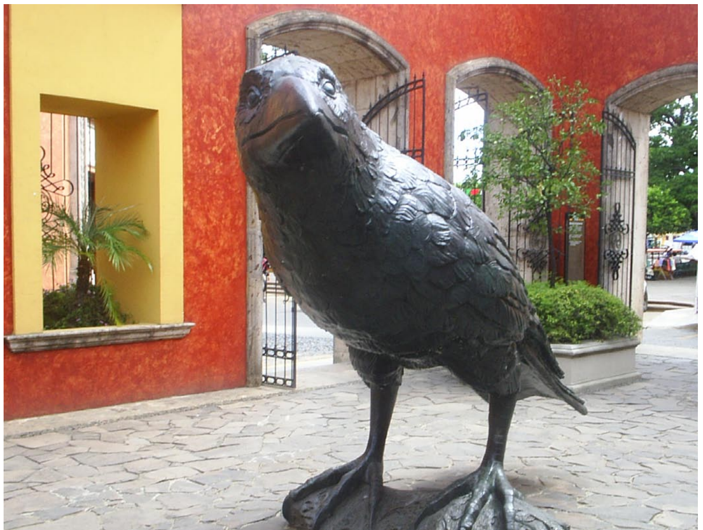
Recepción de Casa de Mundo Cuervo.

Con la experiencia que dan 200 años de historia ininterrumpida y más de 100 años de experiencia en el mercado internacional, José Cuervo ha creado Mundo Cuervo, ubicado en la zona de Tequila.