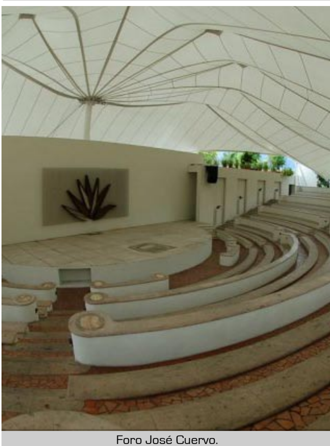
Foro José Cuervo.

Mundo Cuervo, un espacio cultural y recreativo para visitantes y eventos, donde existen actividades especiales para toda la familia, se encuentra situado en el centro de Tequila, en la Calle José Cuervo 73, junto a templo de Santiago Apóstol en plaza principal.