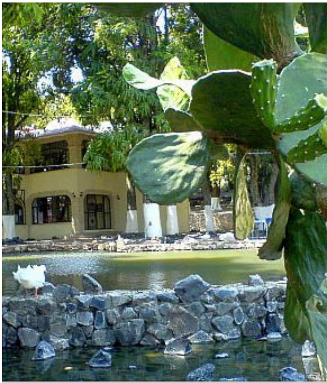
Vista del Hotel Boutique La Cofradía.

Antigua finca que data de finales del siglo XVII, lugar en donde fue fundada una Cofradía religiosa llamada “Cofradía de la purísima concepción” en el año de 1850, cuyos miembros se dedicaron al cultivo del agave.