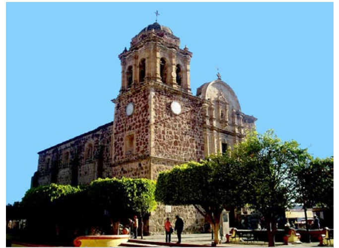
Parroquia en Tequila, Jalisco.

Existe en el museo una botella registrada en los récords Guinness, como la botella de vidrio soplado más grande del mundo.