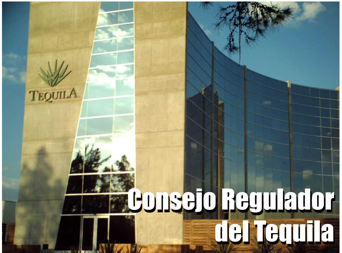
Sede del CRT en la ciudad de Guadalajara ubicado en Av. Patria #723, Col. Jardines de Guadalupe.

Como se menciona en un principio, el Consejo Regulador del Tequila avala a los productores de agave, a los industriales tequileros, a los envasadores, a los comercializadores y a la representación gubernamental.