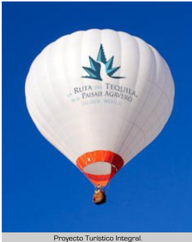
Proyecto Turístico Integral.

Recientemente los gobiernos estatal, federal y la iniciativa privada dieron a conocer el presupuesto que invertirán este 2010 en la Ruta del Tequila.