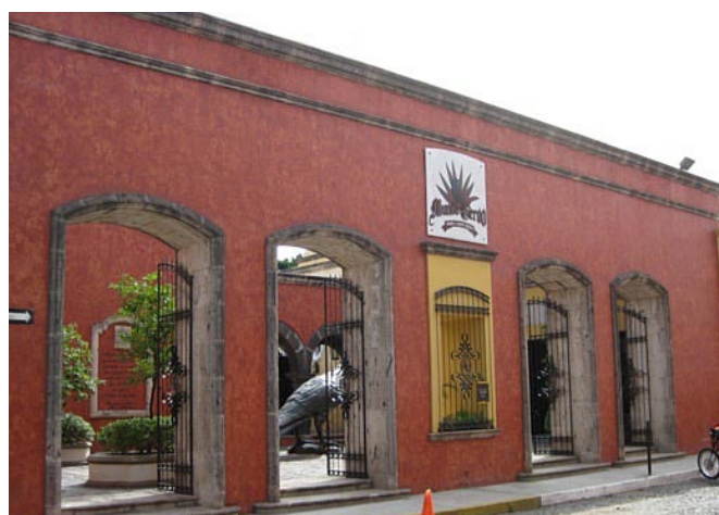
Mundo Cuervo - Centro Histórico.