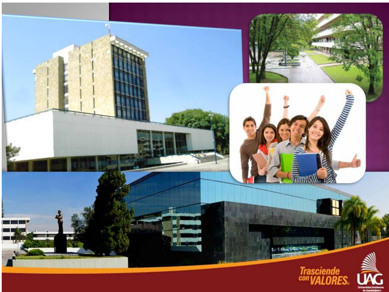
Universidad Autónoma de Guadalajara - Siglo XXI.

La sede principal de la Autónoma de Guadalajara es Ciudad Universitaria, ubicada en el municipio de Zapopan; en dicho lugar se encuentra la rectoría y la mayoría de las carreras que se imparten. Cuentan también con el Instituto de Ciencias Biológicas, UAG campus Santa Anita (Tlaquepaque), UAG Campus Tepic, UAG Campus Tabasco, Instituto Autónomo de Educación de Tecomán (IAETAC), el sistema de educación básica y media José Vasconcelos en Baja California, y la primaria Antonio Caso mas Santa Anita.